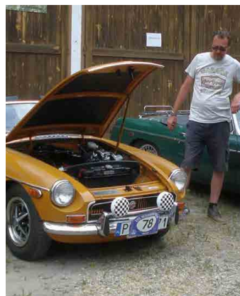
Velké zastoupení měly anglické vozy.