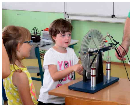
Ve třídách probíhaly zajímavé pokusy...