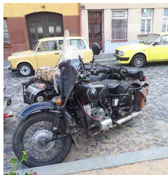
Větší zastoupení měly tradičně motocykly.

Soutěžící startovali z mšenského náměstí Míru v minutových intervalech a na cestě je čekalo sedm kontrolních zastávek, kde řidiči a posádka plnili vědomostní a technické úkoly.