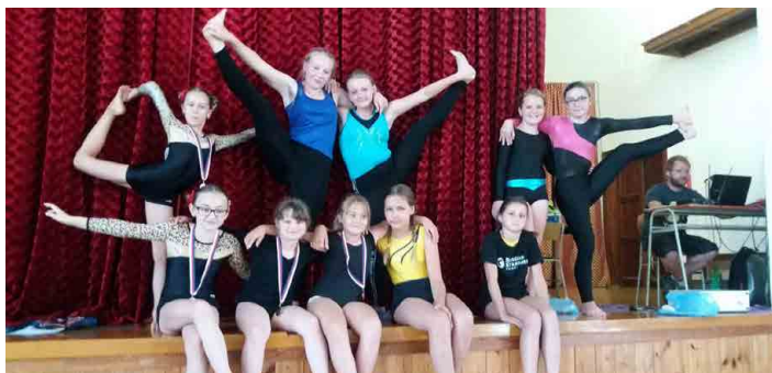
V Kostelci se představilo deset mšenských sokolek.

Většina děvčat bohužel závodila ve stejné kategorii, a tudíž proti sobě.