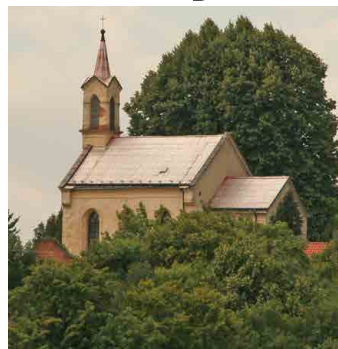
Kostel sv. Jiří.

My přece nejsme o nic horší než oni. A tak se jednou měsíčně vydávám dolů skalami přes malebné údolí nahoru opět skalami po vytesaných schodech až ke kamenné kostelní zdi. Ta se péčí města Mšena a památkářů nyní opravuje, a tak to tam bude ještě o kousek hez-