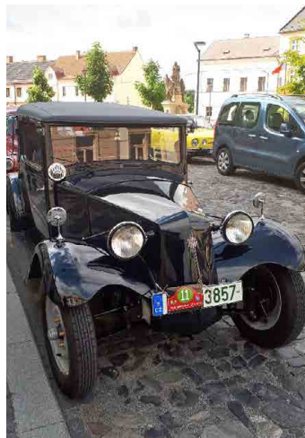
Mezi vozy byla i krásná tatrovka.