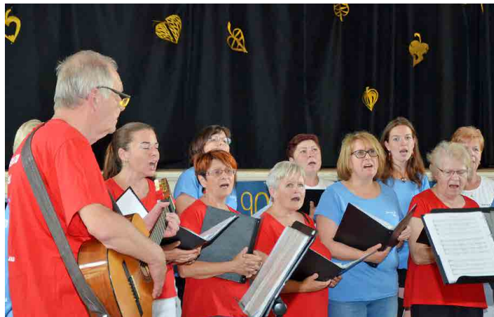
Divákům se představil také mšenský pěvecký sbor Intermezzo.