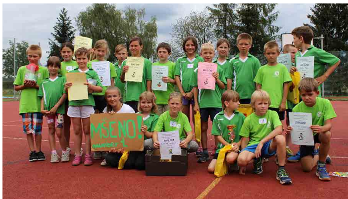
Mšensští školáci obsadili druhou příčku.

Organizátoři, učitelé včetně žáků 9. ročníku se velmi zodpovědně zhostili funkce rozhodčích a samotný závod, kterému navíc prálo počasí,