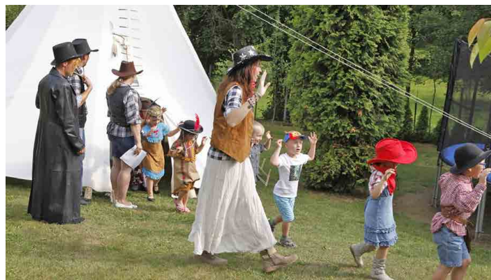
Školková slavnost měla opět velký úspěch.

tanečků a krátkých scének. A ani rodiče nepřišli zkrátka. Soutěžili, tančili a bavili se. A aby byla slavnost dokonalá, postarali se rodiče i o bohaté občerstvení. Malí předškoláci byli vyznamenáni šerpou a dostali knihu a pamětní list. Na závěr vystoupení si paní učitelky pro rodiče připravily stylové taneční vystoupení. Slavnost se vydařila a to nejen díky přírodě, která nám dopřála nádherné počasí, ale i díky