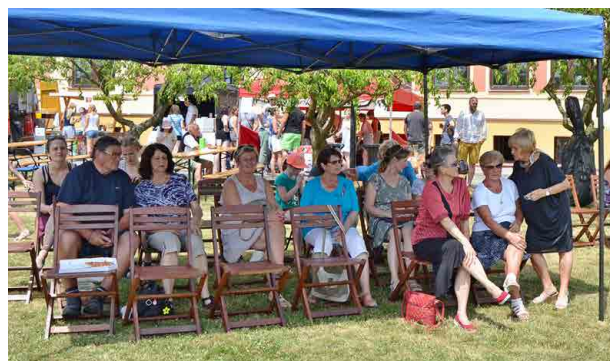
Před školou návštěvníkům vyhrávaly kapely.

Klid ve škole není ani letos. „Kompletně předěláváme tělocvičnu, a to nejen podlahu, ale i topení, osvětlení, repasujeme dveře a dojde i na obložení stěn. Navíc průběžně rekonstruujeme vnitřní osvětlení školy, kde instalujeme nové LED panely,“ přiblížil starosta. Jiří Říha