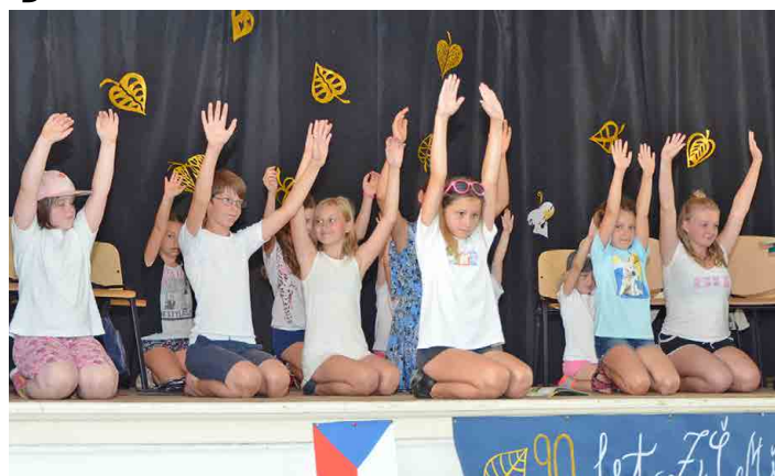
Školáci se svými učiteli nacvičili řadu vystoupení.

školy Jiřina Trunková a dodala, že několik týdnů před oslavami poslali osobní pozvánky zhruba sto dvaceti bývalým zaměstnancům školy. Řada z nich si akci nenechala ujít.