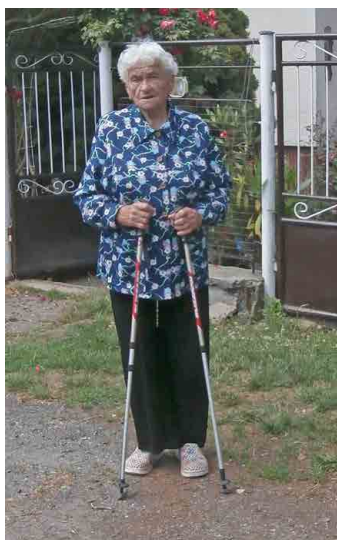
Jubilantka je stále velmi aktivní.

poledne musí ujít svůj kilometr. Na večeri třeba zapomene, ale na procházku nikdy.