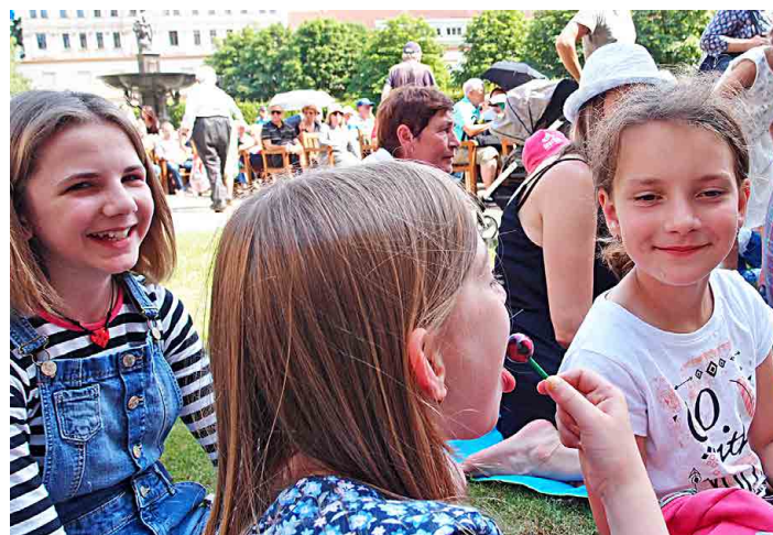
Výpravě ze Mšena se ve Valdštejské zahradě líbilo.