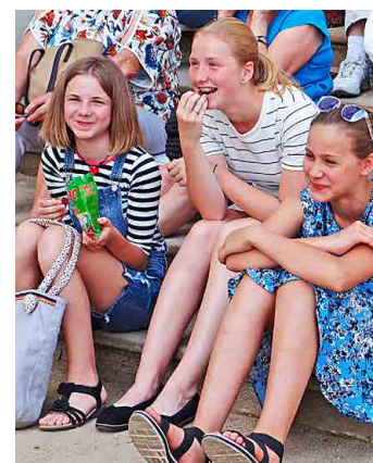
Děti obdivovaly pestrobarevné vějíře z pavích ocasů.