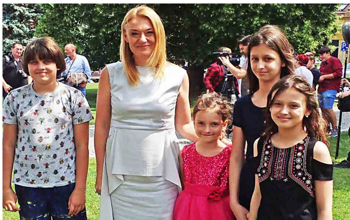
Mladí umělci se setkali s Magdalenou Koženou.

Hudební obor Základní umělecké školy Mšeno se letos připojil k rozsáhlé akci, kterou organizovala ZUŠ Benátky nad Jizerou a účastnilo se jí šest škol: ZUŠ Poděbrady, ZUŠ Nymburk, ZUŠ Benátky nad Jizerou, ZUŠ Mladá Boleslav, ZUŠ Mnichovo Hradiště a ZUŠ Mšeno,