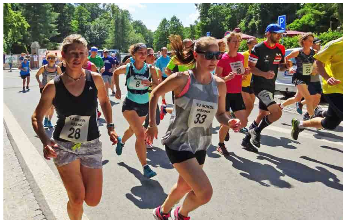
Před Během naděje odstartovala Mšenská desítka.

Pořadatelé z TJ Sokol Mšeno v roce 2015 přidali k charitě i závod.