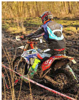
Některá místa byla náročnější.