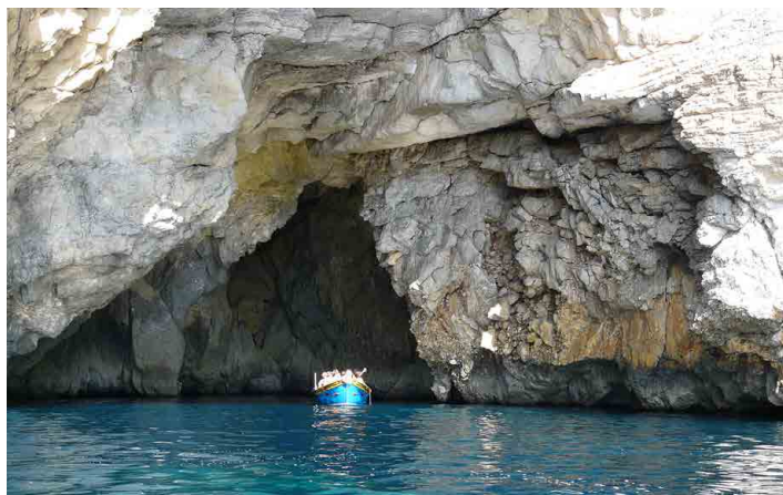
Na jihu Malty musí každý turista navštívit Modrou jeskyni.