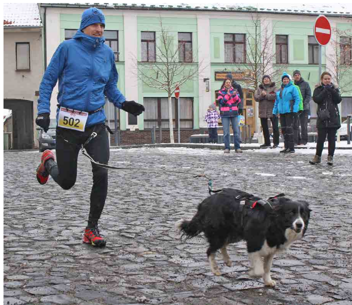
Část běžců vyrazila na trať se svými psími kamarády.

Pro každého z nás je ctí se postavit na start po boku dlouholeté reprezentantky ve skyrunningu, jed-