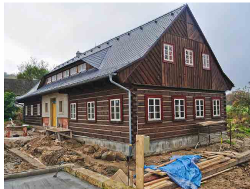
Roubenky prý rostou doslova před očima. Horší je to s jejich rekonstrukcí. Foto: archiv R. Střihavky (3x)