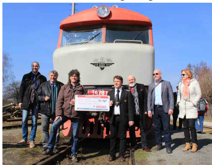
První jízdy se zúčastnili představitelé měst, jimiž vlak projíždí.

Podle Ctirada Mikeše bude určitě nějaký čas trvat, než si lidé na vlaková nádraží opět najdou cestu. Během posledních let totiž zájem o dráhu spíše upadal. „Bude trvat dlouho, než se lidé naučí využívat to, co tu bylo před třiceti lety běž-