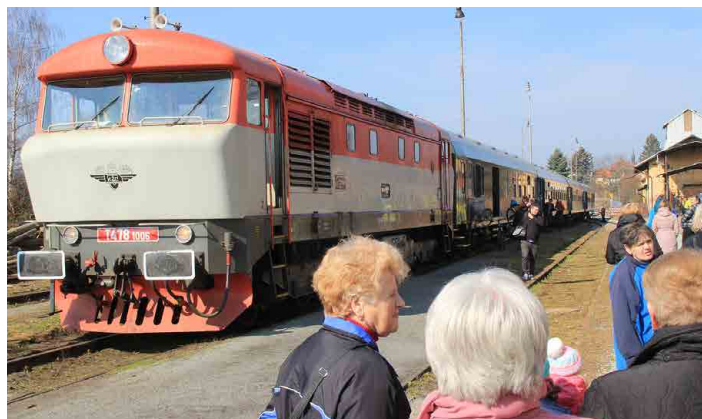
Provoz Kokořínského rychlíku mezi Prahou a Mšenem je podle smlouvy zajištěný na následujících deset let.

„Nejméně deset let jsem žádal, aby se zlepšila železniční doprava do Mšena, která se opravdu zača-