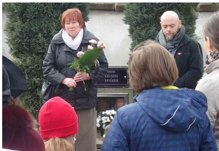
Pěvecké soutěži předcházela pietní akt na hřbitově.