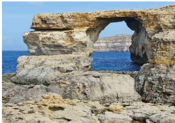
Azurové okno se vloni na jaře zřítlo do moře.

Já se ale chci zmínit o dvou nádherných přírodních úkazech. Na jihu Malty musí každý turista navštívit Modrou jeskyni. Není ovšem jen jedna jako na italském ostrově Capri. Tady se jedná o soustavu řady jeskyní, pro turisty přístupných na člunech. To si nemůžeme nechat ujít. Do malých nízkých člunů se nás vždy posadí osm, dostáváme záchranné vesty a už nás lodník s Yamahou na zádi veze do jeskyní. Některé otevřené, do jiných vplouváme úzkým průjezdem. Jeskyně vyhloubil v měkké hornině za dlouhé věky mořský příboj. Je to nádherna, voda má v každé jeskyni jinou barvu, záleží vždy na složení a hloubce dna. Pokud do jeskyně proniká světlo, má