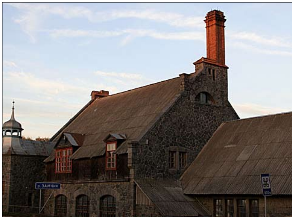
Nemirov – elektrárna

(Dokončení článku najdete v prosincovém čísle Mšenských novin.)