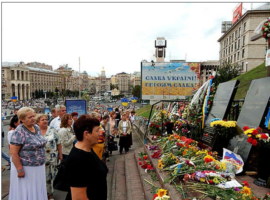
Pomníčky na Majdanu