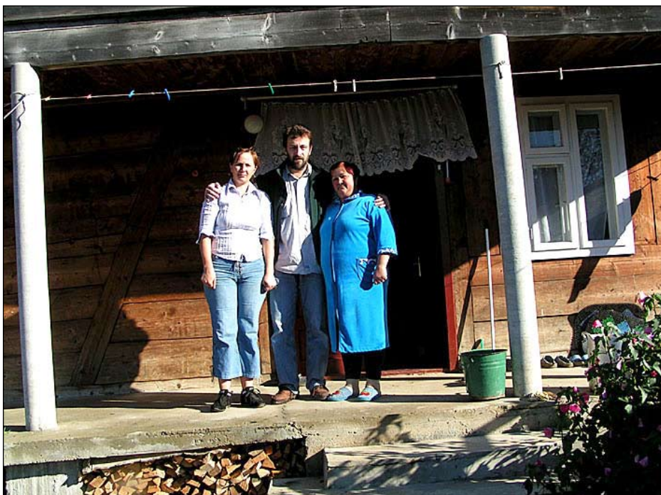
Naše švadleny u nich doma

Další věc, kterou bychom mohli rozebrat dlouho. Pro mě osobně je hodnota osvobození Prahy Sovětskou armádou, speciálně Prahy, téměř nulová. Že jsem v dětství vyrůstal mezi sovětskými okupačními tanky, které stály před naším domem, o tom už ani mluvit nechci. Ale každopádně Rusové tady mohou být znova. Kdykoliv se jim zlíbí, pokud budeme takhle měkce přistupovat k Rusku, že vlastně je jedno, že obsadili pětinu území Gruzie, že vyvraždili 100 tisíc svých občanů v Čečně – občanů civilistů – prý v rámci boje proti terorismu. A dneska boj proti terorismu vyčítají Ukrajině. Opravdu – pokud budeme vychvalovat Rusko, které je pro celý civilizovaný svět jednoznač-