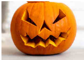
Dýně jsou v posledních letech ve velké oblibě.

„báječné“ umělé chuti, která ananas nepřipomínala ani omylem. Později, když jsme my, děti, odrostly, se maminka odvážila experimentovat s dýňovým kompotem přidáním vína nebo rumu. To už bylo lepší, ale mně se pořád zdálo, že využívat dýně jen na kompot je škoda.