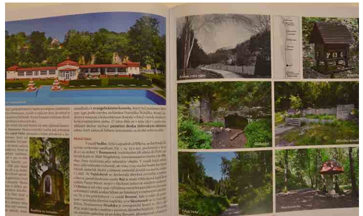
Na řadě fotografií najdeme místa v lesoparku Debrž.

V knize za 590 korun najdete celkem 552 stránek s bezmála dvěma tisíci fotografií a kreseb. (tz)