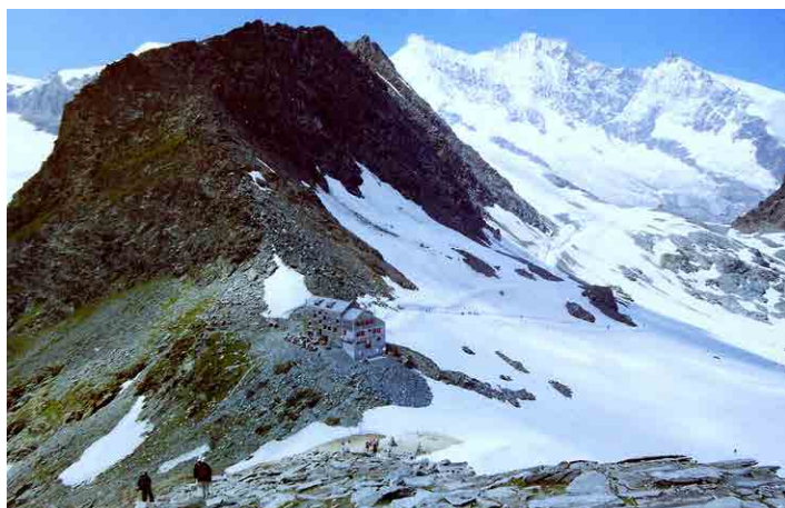
Brittaniahütte z Klein Allalin, vzadu Dom.