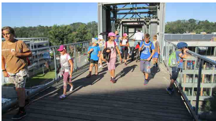
Děti v rámci příměstského tábora navštívily řadu zajímavých míst.