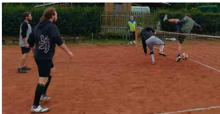
Počasí nohejbalistům náladu nezkazilo.