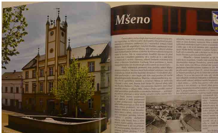
Mšeno je v publikaci Mladoboleslavsko věnováno hned několik stran.

V úterý 6. října zahájilo Infocentrum Mladá Boleslav prodej knižní novinky ze své produkce, a to publikace „Mladoboleslavsko“. V knize je několik stránek věnováno také městu Mšenu, které leží těsně za hranicemi boleslavského okresu.