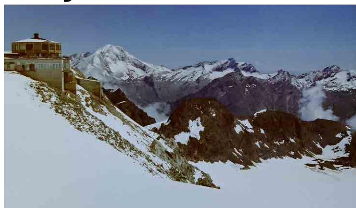
Kruhová restaurace v sedle Mittelallalin ve výšce 3500 m.

Nad stanicí metra vybudovali zajímavou prosklenou kruhovou restauraci, za jednu hodinu se celá otočí kolem dokola. Jdeme se tam podívat. Hned nás číšník usazuje, musíme si něco dát. Zkusíme švýcarské pivo, uvidíme, jestli se to