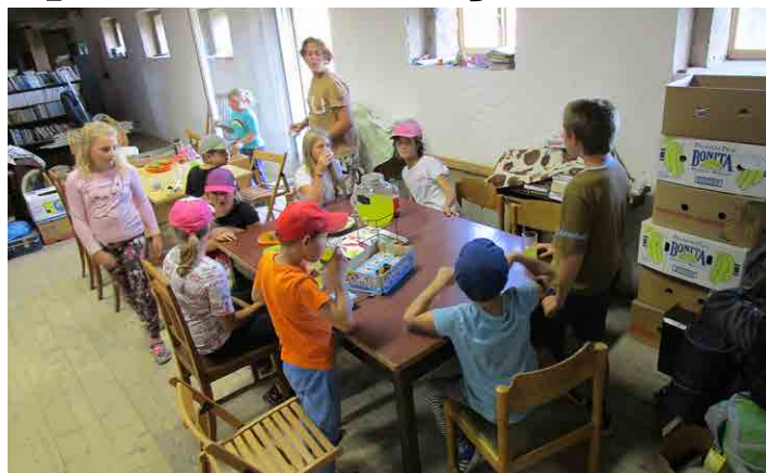
Na táboře si děti užily nejen výlety, ale i ruční práci.

Letos v závěru srpna se ve Mšeně konal už počtvrté příměstský tábor. Účastnilo se ho 15 dětí, což bylo asi nejvíce v jeho historii a i program stál letos za to. Posuďte sami - provázal nás životní příběh a všestranná vzdělanost Jeronýma Pražského,