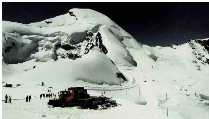
Allalinhorn, vpravo sedlo pod Feechopf.