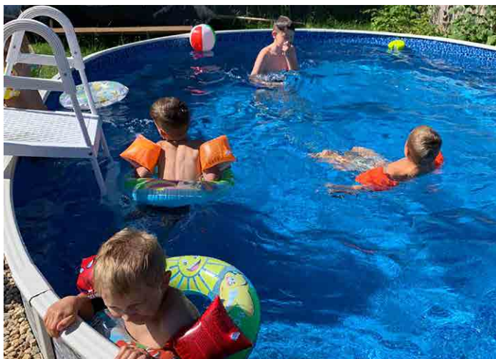
Za teplého počasí si kluci a holky užívali v bazénu.

A je toho opravdu hodně, co se dá dělat. Přijali jsme pozvání paní Winterové z Ekocentra Koniklec na výlet do Vidimi. Uprostřed krásné přírody, daleko na samotě, děti poznávaly tajemství lesa. Paní Hrdličková zahrála dětem ve