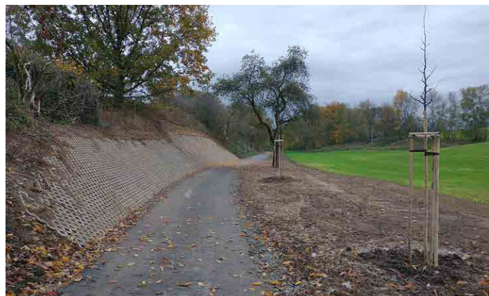
Okolí cyklostezky bylo upraveno a doplněno zelení.

Řadu let se nejen ve Mšeně hovoří o vytvoření stezky ze Mšena do Velkého Újezda přes Šibenec, kterou se snaží prosadit právě obec Chorušice, pod níž Újezd spadá. „V posledních letech nás dokonce tlačili, abychom se do toho pustili s jejich pomocí. Při vědomí ceny takové stavby a existenci jiných priorit jsem ale odolal. Nyní je plán takový, že komunikace vznikne po realizaci komplexních pozemkových úprav na náklady EU,“ uzavřel starosta. Jiří Říha