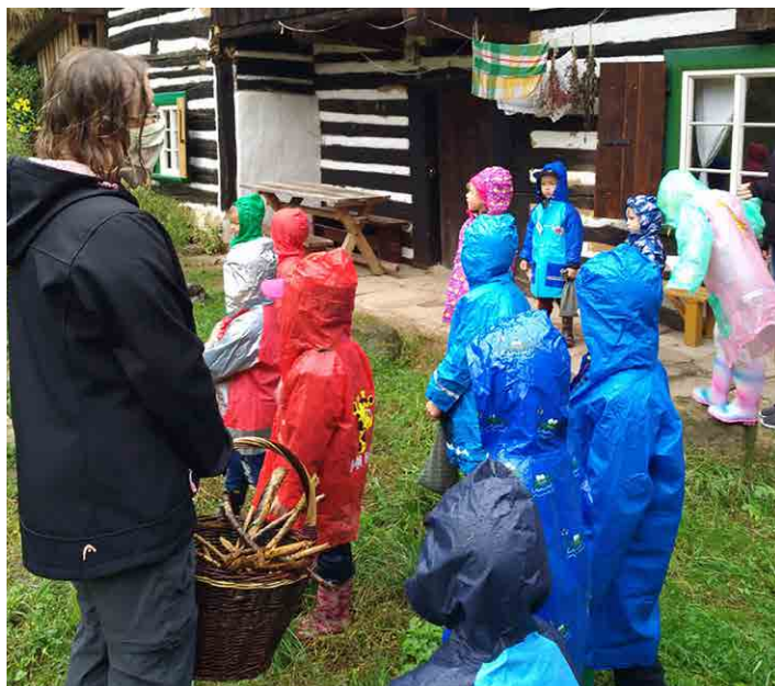
Děti se podívaly do Ekocentra Koniklec v Horní Vidimi.