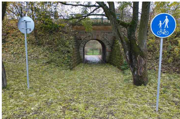
Na novou stezku pro chodce i cyklisty upozorňuje značka u viaduktu.

Stezka, kterou mohou nyní využívat nejen cyklisté, ale i chodci a bruslaři, dala městu zabrat především v rámci přípravy. Šlo hlavně o pozemky pod plánovaným asfaltem. „Tento proces se táhl řadu let. Několik pozemků nám chybělo, ale byly státu, takže to vypadalo nadějně. Některé jsme si jen pronajali, protože jiná možnost v tu dobu nebyla, o jiné zažádali. Jenže se ukázalo, že u některých byl převod blokován kvůli nedokončeným církevním restitucím,“ vysvětlil nelehkou situaci starosta