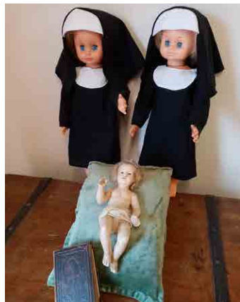
Na Jezulátko v muzeu dohlížejí dvě jeptišky.

Děda už dávno není mezi námi, já už jsem také poněkud starší, ale v kouzelnou moc Jezulátka jsem věřit nepřestala. Jako malá jsem si ho hrozně přála pod stromeček, děda mi vždy říkal, nemůžeš ho mít jen ty, je přeci pro všechny... Po spouště let přesně okolo Vánoc se mi do rukou dostalo voskové Jezulátko, o něco menší než je na Malé Straně, ale neméně krásné. Je celé z vosku, což je patrně na odštipnutém palci levé nožky - tak zkusím návštěvníky našeho muzea, z jakého materiálu miminko je, a toto je malá nápověda. Pravou rukou žehná všem. V tom měl můj děda pravdu, je pro VŠECHNY! Všichni si můžeme něco přát a možná se nám to vyplní,