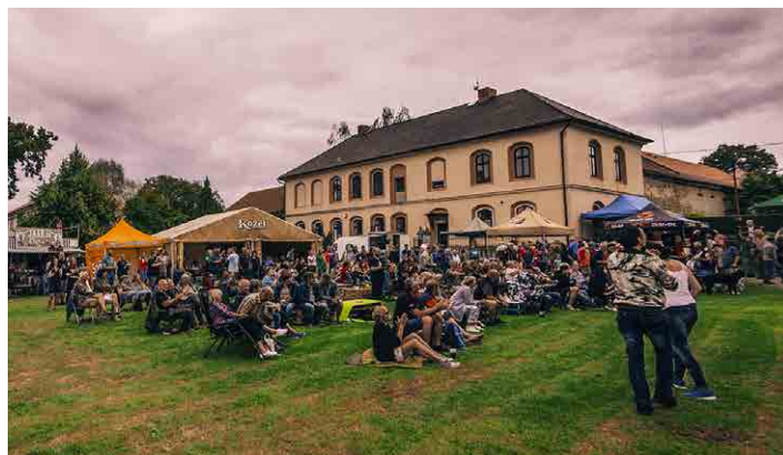
4. ročník festivalu si nenechaly ujít desítky lidí.