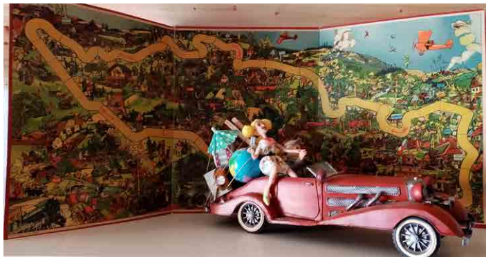
Stará hra představuje původní Masarykův okruh.

První kapitola úctyhodné historie Masarykova okruhu se začala psát v roce 1930 v lesích za rozrůstající se brněnskou metropolí. Tehdy narychlo a s velkou podporou legendární závodnice Elišky Junkové začala vznikat závodní trať, jejíž jedno kolo měřilo neuvěřitelných 29,1 kilometru. Vedla po běžných silnicích, které v rekordně krátké době musely projít rekonstrukcí. Na trati se střídalo několik povrchů – od moderního asfaltu přes obvyklejší beton až po jezdci nenáviděné dlažební kostky v klesání k Popůvkám. Poprvé a naposledy kroužili jezdci po Masarykově okruhu proti směru hodinových ručiček.