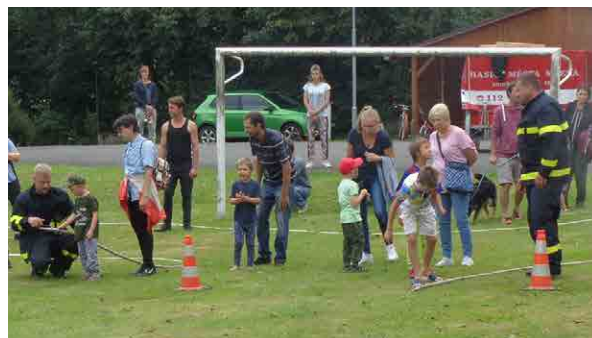
Hasiči ze Mšena přivezli i svou miniaturní tatičku...