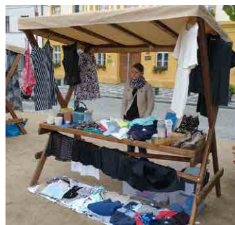
Prodejců bylo patnáct...

Na blešák dorazilo patnáct prodejců se všemi možnými věcmi. Prodáváno se oblečení, bižuterie,