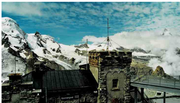
Gornergratt, budova stanice lanovky a hotelu ve výšce 3 310 metrů.