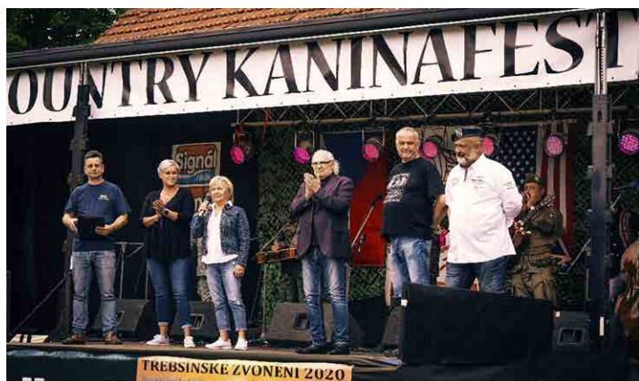
Částka, kterou pořadatelé na festivalu vybrali, poputuje na podporu mšenského domova seniorů.