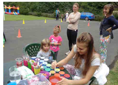
Nechybělo ani oblíbené malování na obličej.