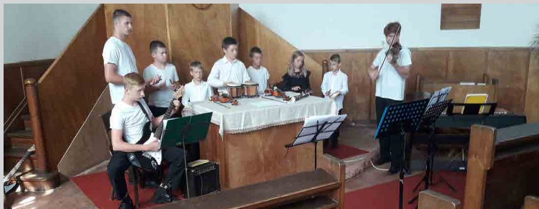
Malí umělci se představili na koncertu ve mšenském evangelickém kostele.

Kolemdoucí tak mohli slyšet zobcovou flétnu, altovou flétnu, tenorovou flétnu, bubínek, triangel, bonga, buben, činel, malé housle, velké housle, kytaru, basu, violoncello, dudy, klavír nebo klarinet. Tolik nástrojů uvádím proto, aby bylo zřetelné, že téměř každý ovládl nakonec nástroje dva a někteří hráli i na čtyři. A to nejmladším účastní-