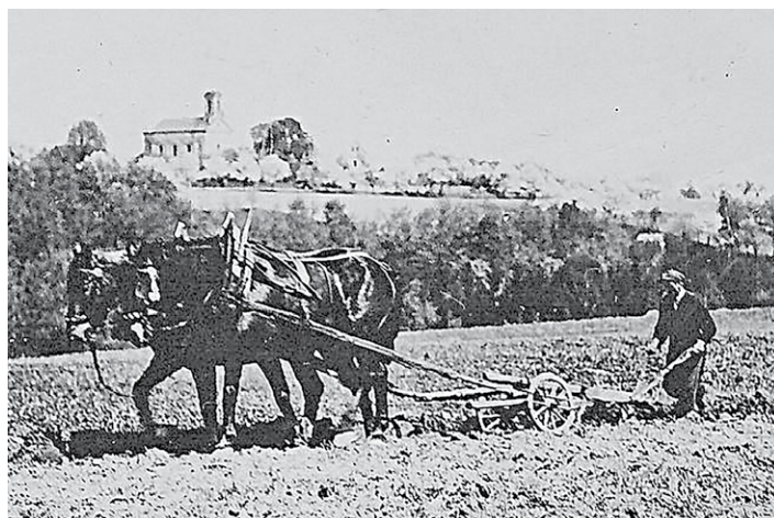
Lidé z Romanova se často živili prací na okolních polích.

Hned na začátku vás ovšem musím upozornit na novinku spojenou s internetovou archivní badatelnou ( http://ebadatelna.soapraha.cz ). Nově zde naleznete knihu s názvem Mšeno 39, netradičně obsahující část jak o narozených, tak o zemřelých. Každého zapáleného badatele jistě potěší, o jaké roky se jedná. V případě narozených můžete vyhledat záznamy z let 1872–1890, zemřelé dokonce až do roku 1941. Na matričních úradech jsou sice k dispozici ještě novější matriky, ale těch se online dočkáme až poté, kdy uplyne 100 let od posledního zápisu narození nebo 75 let od posled-