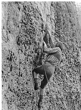
VI. Mencl, Sváteční věž - Severní stěna, VII, prvovýstup - pokus, červen 1981.