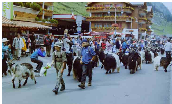
Pozornost poutalo velké stádo koz procházející Zermattem.

Druhý den pobytu vyrazíme na nejdelší trasu, naším cílem bude městečko Zermatt a tam už si každý vybere celodenní program. Stavíme se ve vesnici Täsh, dále už musíme jet místním elektrickým vlakem, motorová vozidla sem nesmí. Tady se dělíme na několik skupin, já jedu