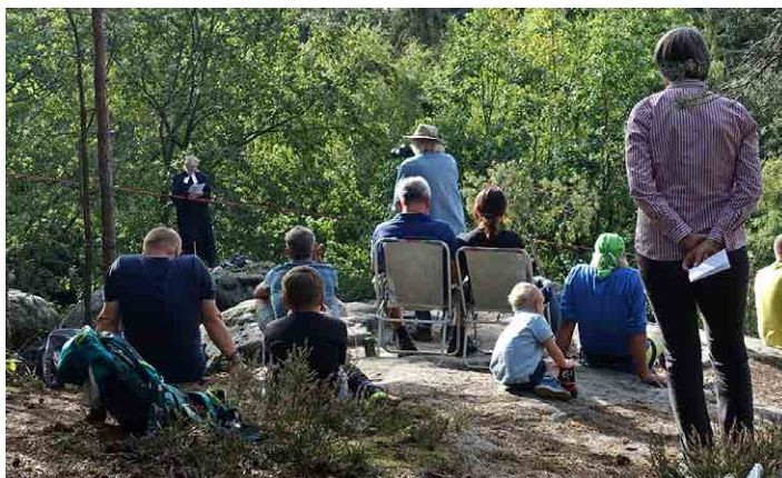
Na Vyhlídkách se sešlo okolo třiceti účastníků.