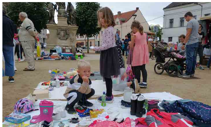
S maminkami na náměstí přišly i děti, která byly ve svém živlu.

nádobí, hračky, knihy a potřebné i nepotřebné cajky. Přidaly se i děti, které z prodeje měly zážitek, a osvojily si tak i jiné dovednosti než jen matematiku. Jsme rádi, že akci navštívilo tolik lidí. Proto nesmíme zapomenout poděkovat prodejcům, všem návštěvníkům a také městu Mšenu za zapůjčení prodejních stánků.