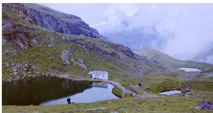
Jezero Schwarzsee na úbočí Matterhornu.