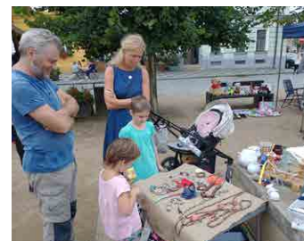
V nabídce bylo všechno možné.