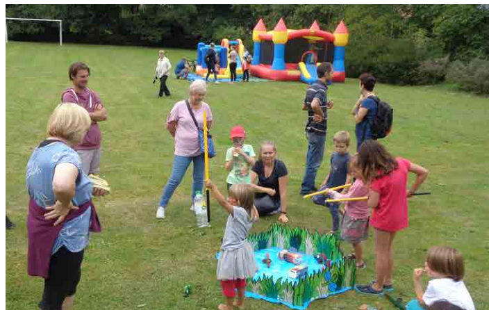
Děti na hřišti čekala spousta her a soutěží.