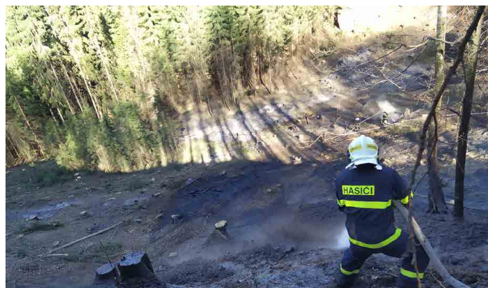
Výjezdy nescházely ani v době koronavirové krize.

nám podařilo získat dezinfekční ekologický prostředek Vertesprit Ank na povrchy, který přerozdělovali dobrovolní hasiči v Libiši. Mšenští hasiči této dezinfekce mezi občany města, školu, školku a obchody rozdali bezmála 450 litrů. Naše jednotka následně distribuovala i dezinfekci na ruce Anticovid, kterou zakoupilo město Mšeno. Této dezinfekce jsme rozdali mezi občany 200 litrů.