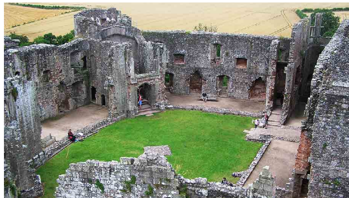
Z monumentálního hradu Raglan Castle toho mnoho nezůstalo.

Jdeme se na tu zašlou slávu podívat. Dnešní podobu získal objekt postupným odklizením troskek na počátku 20. století, takže se dá všude bez obav procházet. O údržbu toho, co z objektu zůstalo, se stará Cadw, to je správa historických památek waleské vlády. Z obranných hradeb stojí už jen základy, někde nízké zdi, obytné klášterní budovy dopadly podobně. Pouze boření kostela bylo moc náročné, tak ho alespoň vyrabovali, cenné předměty odvezli, zbořili střechy, vytloukli okna a dál už jim to asi připadalo moc pracné. Vandalský úkol byl splněn, v troskách nejde žádný církevní obřad pořádat. Jdeme do kostela. Kudy, to je teď jedno, rozbořených vchodů máme k dispozici několik. Kostel má půdorys kříže, musel být dost vysoký. Věže a stropy žádné, z oken se zachovaly pouze některé lomené oblouky. I kamenná výzdoba kolem nich byla stržena. Prostě vandalství jako z učebnice. Můžeme mít akorát vztek a toho „vandalského tlustocha“ Jindřicha proklínat. Stejnou náladu měl jistě každý, kdo sem zavítal před námi. Ach jo! Jednu zdejší raritu ovšem v našich kostelích nevidíme. Kdo se u nás může kostelem