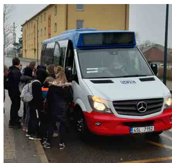
Integrace měla přijít už na jaře, zasáhl ale koronavirus.

► Umožnění nákupu výhodného předplatného jízdného, které je ve vámi zvolených pásmech PID platné na všech linkách PID všech dopravních prostředků. To není bez integrace často možné, neboť jednotliví dopravci si navzájem jízdenky neuznávají. Lze tím významně ušetřit zejména při pravidelnějším cestování.