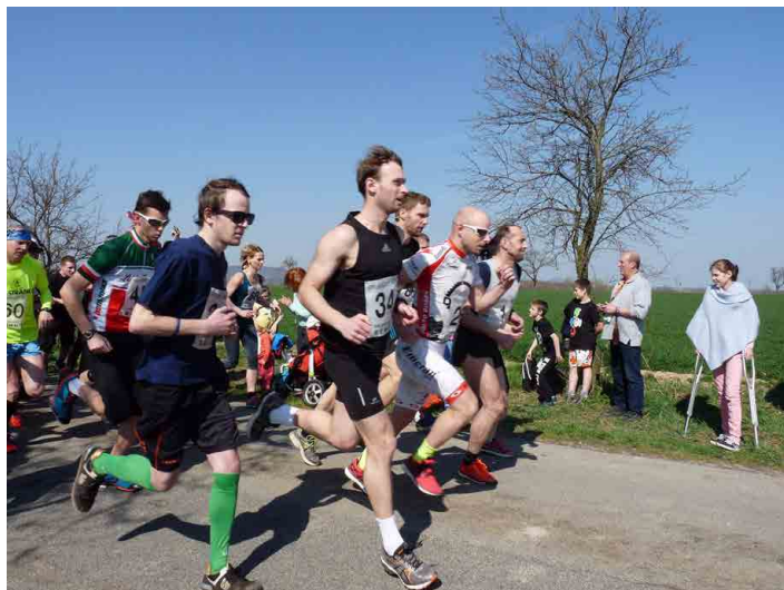
V dubnu bývá počasí nejisté, v červenci se běžci jistě zapotí.