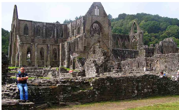
Celkový pohled na klášter Tintern Abbey. Foto: Zdeněk Bergl (4x)