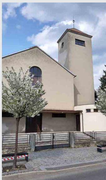
Evangelický kostel se opět otevře veřejnosti.

ru Ensemble Forte Fortuna - 19 - 20 hodin