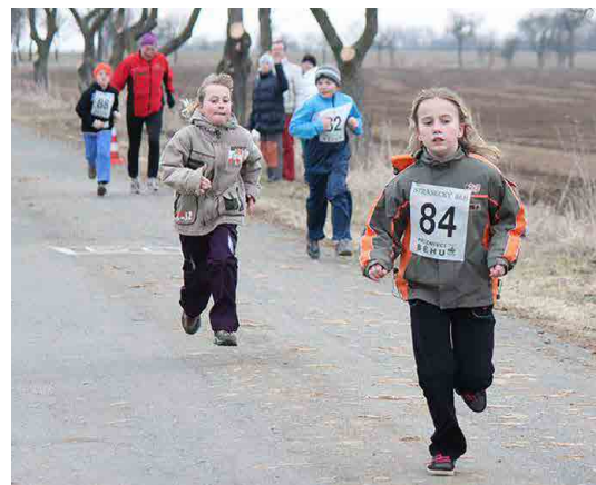
Stránecký běh bývá vyhlášen pro všechny kategorie, svou trasu mají i děti.

pistole zahájí neméně oblíbený Stránecký pochod a na závodní dráhu vpustí nadšence s hůlkami, rodiny s malými dětmi i pejskaře.