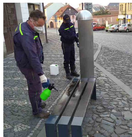
Mšenští hasiči vydávali dezinfekci občanům a dezinfikovali některá veřejná prostranství ve městě.