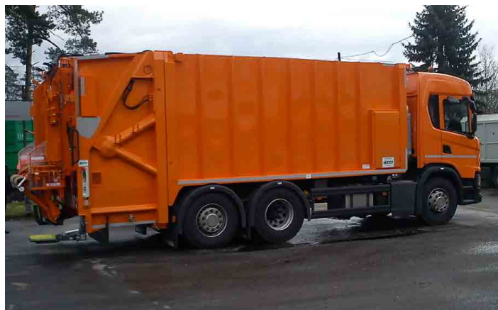
Sdružení 12 obcí, mezi nimiž je Mšeno, pořídilo „kukačku“.

Zároveň jsme v rámci téhož svazku získali EU dotaci na pořízení hnědých nádob na bioodpad, které nyní můžete získat od města do zápůjčky. Jde o nádoby o velikosti 120 a 240 litrů, zápůjčka i svoz jsou zdarma. Přesunutím bioodpadu zejména z domácích kuchyní do hnědých nádob chceme snížit hmotnost směsného odpadu, který je skládkován na skládce, a tím do budoucna připravit systém na to, že cena za uložení či spalování tunu bude několikrát vyšší. Obsah hnědých nádob bude kompostová-