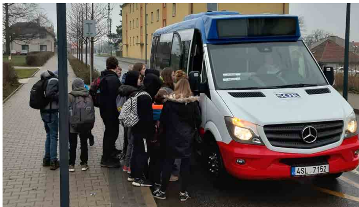
K integraci mělo původně dojít v první polovině roku.

Nový termín integračních projektů pak bude následně stanoven s odstupem čtyř až šesti týdnů po provedeném zhodnocení stavu připravenosti jednotlivých projektů