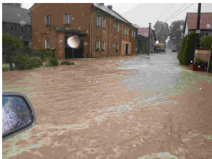
Velká voda v roce 2014 zaplavila celou spodní část Újezda.