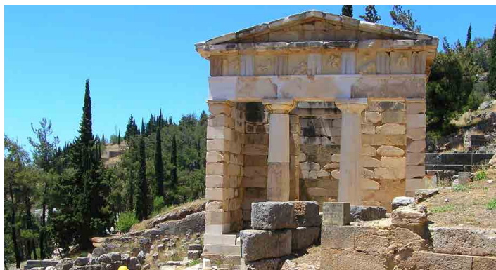
Athénská pokladnice byla znovu postavena z původního kamene.

Pokračujeme a stoupáme v úmorném vedru k divadlu. Polokruhovitě uspořádané hlediště na strmém svahu s poměrně zachovanými kamennými sedadly poskytovalo místo pro pět tisíc diváků. Pohled z horního ochozu na celý objekt stojí za tu námahu při stoupání. Posadíme znavená těla a na chvíli se staneme