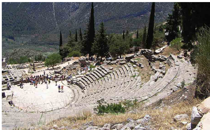
Představení v divadle sledovalo až 5000 diváků.

jinde bylo leccos odvezeno nebo spíše ukořistěno do jiných muzeí po Evropě nebo do soukromých sbírek. V celkem třinácti sálech vystavují zrestaurované sochy, mnohdy na nich vyčnívající části těla chybí, hlavně u soch představujících mužské postavy. Je to nádherná, nejsou tu jen sochy kamenné, tehdy už uměli vyrobit i nádherné památky z bronzu. Vrcholem umění je zachovaná postava Delfského vozataje darovaná sicilským králem Polyzaem na památku jeho vítězství v závodě čtyřspřeží na Pýthijských hrách roku 484 př. Kr. Pod sutinami se zachovala pouze socha stojícího vozky, z koňského čtyřspřeží zbylo jen několik úlomků. Vystavují je ve vedlejší vitrině s nákresem celého původního sousoší. Samozřejmě se jedná o odhadnutou podobu, muselo to být ovšem dílo dokonalé. Před muzeem se mi podařilo spatřit něco, co se málokdy vidí. Koukám na kmen stromu na živou cikádu, je to poprvé, co ji vidím. Vždycky všude na jihu neustále řvou, hlavně v noci, a jak se člověk přiblíží, zalezou někam do šterbiny stromu. Tato zřejmě právě opustila kuklu, dovolí mi ji zblízka vyfotit a dokonce posímat. Bylo to tu krásné, ale čas se nám naplnil, odjíždíme do místa ubytování.