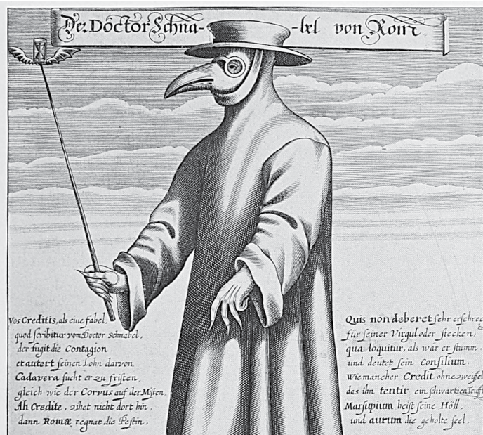
Lékař z dob morové epidemie měl typický „zobák“ vyplněný bylinami.

Přesuneme se nyní do 19. století. Stejně jako mor zasáhla naše území v několika vlnách také cholera. Matriční záznamy z roku 1866