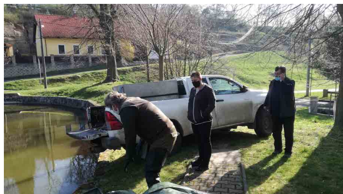
Stránečtí rybáři pravidelně dokupují mladé kapříky.

Ve středu 22. dubna se uskutečnil kontrolní den probíhajících