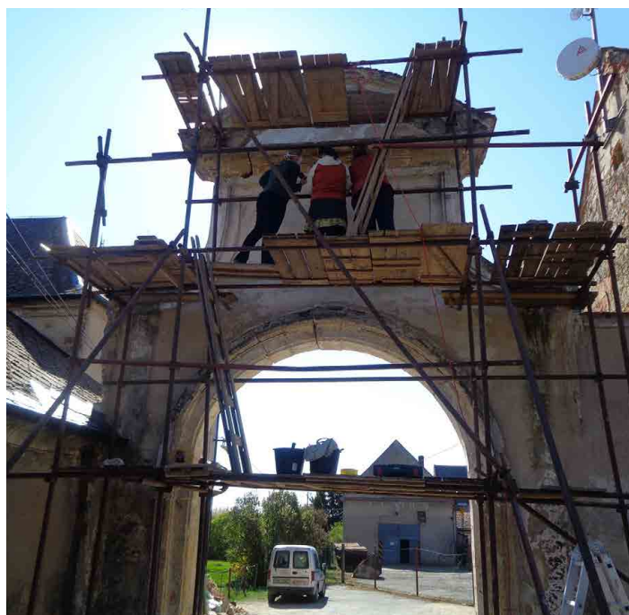
Na opravě brány stráneckého zámku se intenzivně pracuje.

prací na celkové rekonstrukci vstupní brány stráneckého zámku. Kontrolní den probíhal za účasti pracovníků památkové péče z Mělníka a Prahy. Restaurátorské práce kamenných částí brány provádí MgA. Tereza Korbelová. Ta seznámila pracovníce odboru památkové péče s postupem prací na kamenné klenbě brány a podstavcích tří okrasných čúček, které byly odvezeny do dílny restaurátorky k potřebným renovacím a opravám.