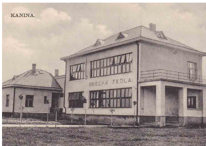
Budova tehdejší obecné školy krátce po výstavbě.

Nejde tu přitom o přesná čísla, ale o ukázání toho, že když chcete, aby vám škola v obci zůstala, chováte se trochu jinak. Na mno-