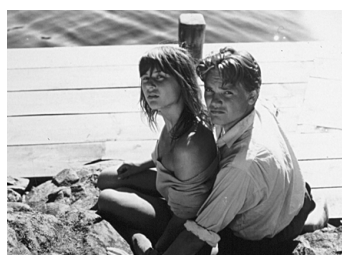
Ze snímku Léto s Monikou...

mitány filmy, které byly natočeny od padesátých do osmdesátých let. Bergman získal za svá díla řadu prestižních filmových ocenění a nominací. Minimálně za tři z filmů, které budou uvedeny, byl Bergman nominován na Oscara (Lesní jahody, Podzimní sonáta a Fanny a Alexander;