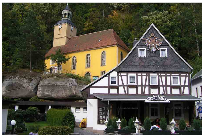
Městečko Oybin s dolním kostelem.