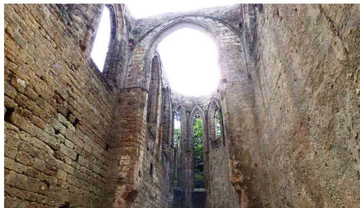
Zřícenina klášterního kostela.

Obejdeme ještě vyhlídkovou trasu kolem kopce, odkud máme překrásné výhledy na město Oybin a okolí. Jsme zase dole, zastavíme se v místním bistru na bratwurstu, ty tady mají opravdu výborné. Velkou