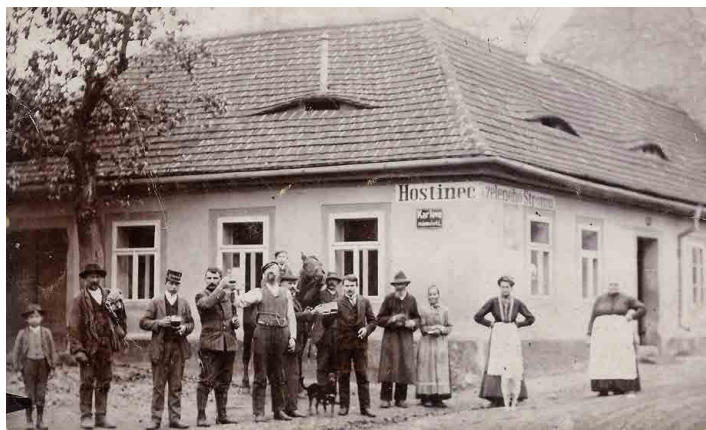
Ve Mšeně to dříve žilo. Hostinec U Zeleného stromu na Karlově náměstí.