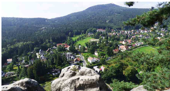
Pohled na město, v pozadí hraniční hora Hvozď.