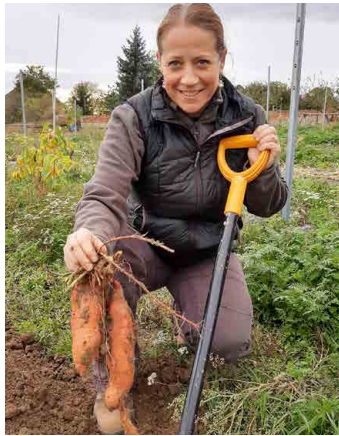
Mezi řádky kiwi rostou i batáty...