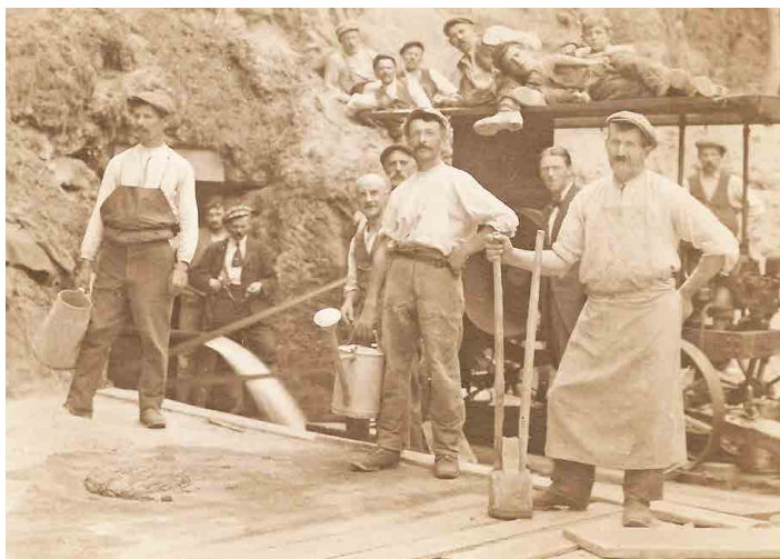
Dobová fotografie zachycuje budování vodovodu.

Stáří vody ze Stříbrníku jsme měřili v Laboratoři užitě a jaderné fyziky ve Výzkumném ústavu pro hnědé uhlí v Mostě už v roce 1975.