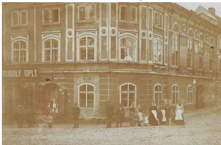
Hotel U Modré hvězdy patřil k nejkrásnějším domům ve městě.

Mšeno - Když projdete kolem domu čp. 35, ani si nevšimnete, že už jste ho minuli. Oprýskaná omítka, ošklivé mříže v oknech přízemí, staré krámy ve výkladu zrušeného obchodu. Přesto každý, kdo prochází městem, okolo jít musí. Mluvím o domě Holuškových. Domě, který je orientačním bodem pro občany města i návštěvníky, domě, který plynule spojuje zástavbu horního a dolního náměstí, domě, který kdysi zněl hlasem lidí, kde lidé bydleli a kde se setkávali.