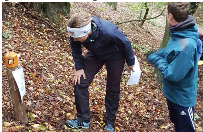
Na trase na děti čekalo několik kontrolních bodů.

vybavených mapou s vyznačenými kontrolami v pětiminutových intervalech zanořilo mezi skály a stromy Kokořínského údolí. Nejkratší dobu pobyl v lese jednočlenný „Jungus team“, který byl za hodinu a půl zpět. Naopak tým „Ano-vytrolíme Jahodu Jaromíra Soukupa“ ztratil na 20. kontrole mapu a v Hospůdce Romanov se znovu objevil až po 4 hodinách a 29 minutách. Zatímco „Tykvičky“ to po dvou hodinách hledání celé