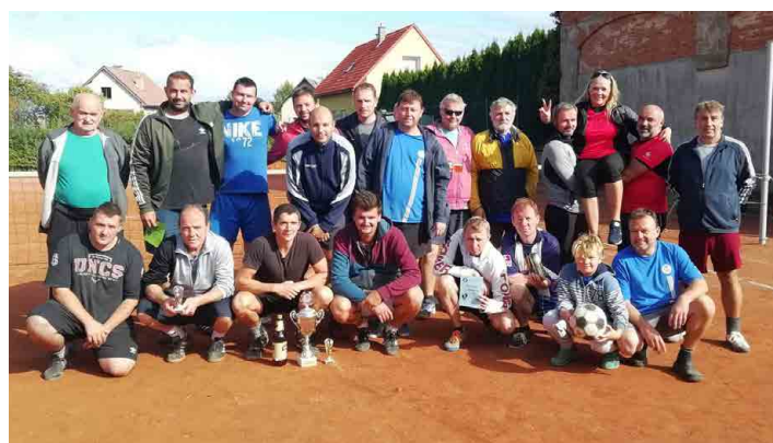
Letos se do turnaje přihlásilo osm týmů.

Letos se konal už XI. ročník nohejbalového turnaje trojic, který nese název Memoriál Václava Mokrého. Účast družstev byla letos slabší, přihlásilo se jen 8 týmů, ale na kvalitu to nemělo žádný vliv. Turnaj probíhal systémem každý s každým a některé týmy předváděly vyrovnané boje. První místo si vybojovalo družstvo Blackout, kterému putovní pohár předali kluci z Dolních Beřkovic. Ti obsadili druhou příčku. O třetí příčku si zahrály dva týmy z Mělníka - Potůček a Potůček mix, lépe to dopadlo pro druhé jmenované. Celý den nás provázelo příjemné a slunné počasí. Děkujeme hráčům i pořadatelům a budeme se těšit na další ročník.