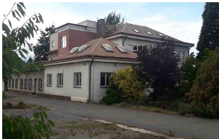
Nyní je budova, která donedávna sloužila ke vzdělávání, opuštěná...

ha zasedáních zastupitelstva museli představitelé školy i o ty malé investice neustále prosit a poslouchat naopak proud výtek a výčitek. Přestože dnes už kdekdo vidí, jaký je to problém či dokonce ostuda a mluví se všelijak. Dnešní jazyk je především řeč peněz. A je jasné, co si obec přála.