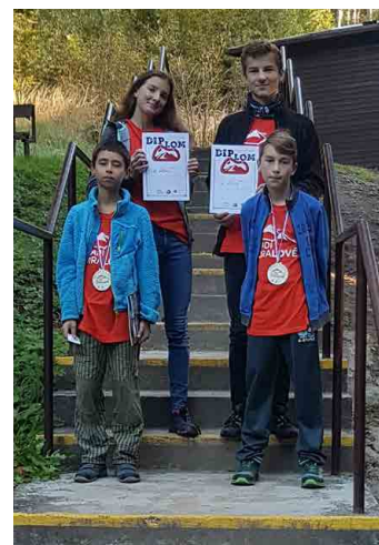
Úspěch v soutěži všechny potěšil.