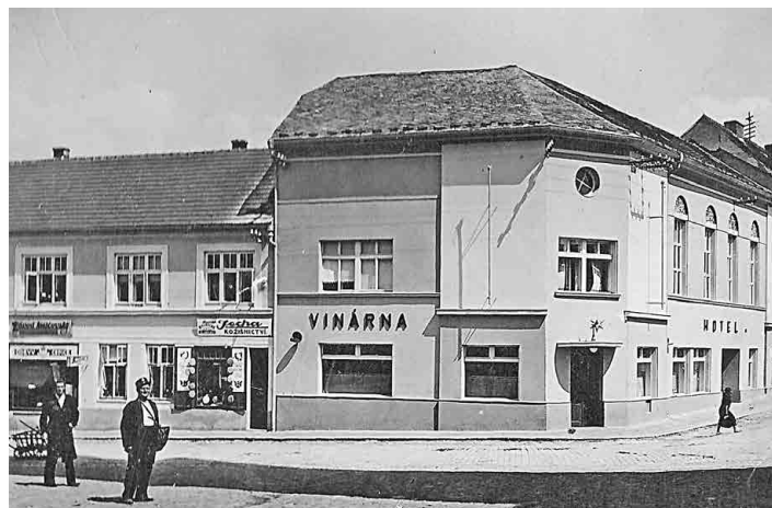
Ve 30. letech dostal moderní, strohou fasádu.

Řemeslník vstupující do budovy slyší šustění peněz potřebných k rekonstrukci, k architektovi promlouvá hlasem zachovalých stavebních prvků, obchodník zajásá