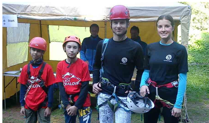
Mšensští horalové polovinu svého družstva omladili.

Po večerním příjezdu do chatového areálu Univerzity Palackého nás zaskočila veliká zima, bylo jen lehce nad nulou. Chatky našťastí byly vyhřívány, tak se v nich dalo přežít. V sobotu ráno byl nástup a rozlosování pořadí družstev z celé země v kategoriích žactvo a dorost a poté už vyrazila první družstva na trať, na které musela překonávat velmi obtížné lanové překážky, dávat první pomoc zraněné osobě, lézt po skalách, slaňovat, prusíkovat (lezení po laně s pomocí smyček), vázat uzly, postavit a složit stan, absolvovat azimutový běh a jízdu na kanoe na přehradě spojenou se sběrem kvízových otázek na březích.