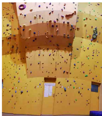
Lezecká stěna se po deseti letech dočkala rekonstrukce.

V průběhu prázdnin jsme se pustili do rekonstrukce lezecké stěny, která je v sokolovně už 11 let. S pomocí mládeže a dalších dobrovolníků byly sundány všechny chyty, které jsme museli omýt. Následně byla stěna natřena a na stavbu nových cest byli pozváni externí stavěči. Během víkendu byly postaveny nové cesty ze starých, omytých chytů, ale zároveň byly pořízeny i nové modernější chyty. Děkujeme všem, kteří se na rekonstrukci podíleli!