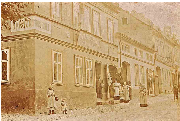
V Karlově ulici k návštěvě lákal Nárožní hostinec.