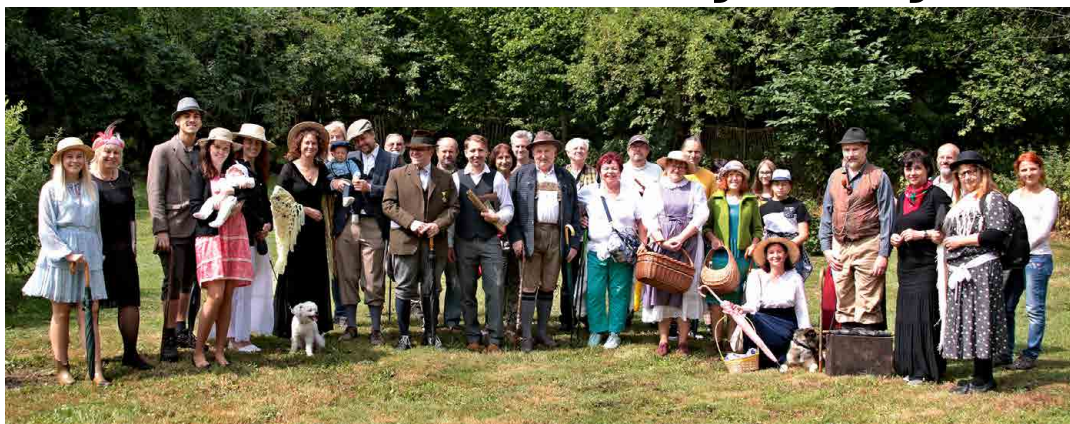
Ačkoli vycházce předpověď počasí příliš nepřála, sešlo se na třicet účastníků.

Mšeno - Řada lidí, kteří se procházejí Mšenem, možná ani neví, jaké pohledy do jeho „nitra“ by se jim mohly naskytnout. I když mnohdy jen výjimečně. Jedna z příležitostí navštívit místa, kam se lidé běžně nepodívají, nastala v rámci akce Po stopách Cinibulkových aneb Časem zpět o sto let, kterou tradičně pořádá náš Okrašlovací spolek pro Mšeno a okolí.