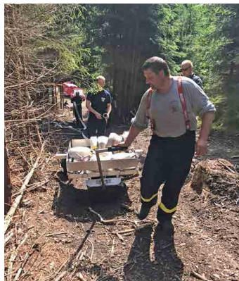
Hasiči v lesích na Mšensku zkoušeli speciální vozítko... Foto: SDH (2x)