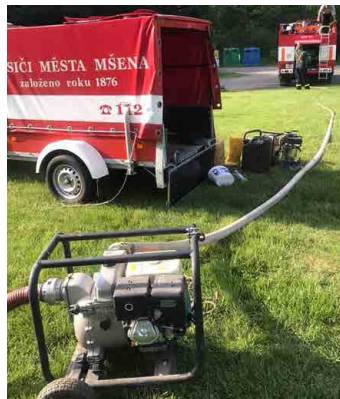
Na Vojetině mšensští hasiči zřídili čerpací stanoviště.