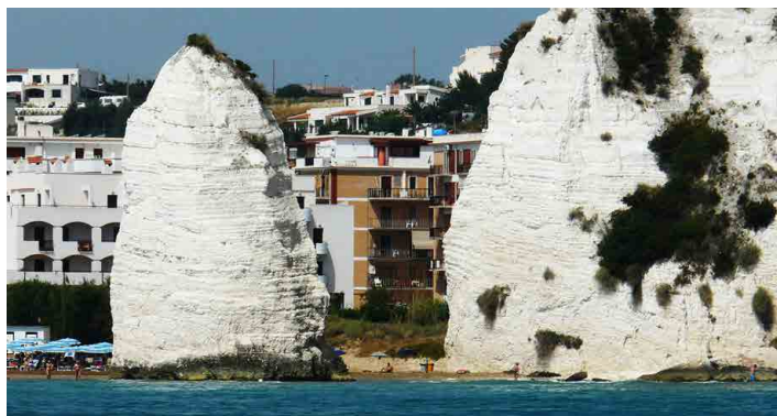
Vápenecový kužel Pizzomuno.