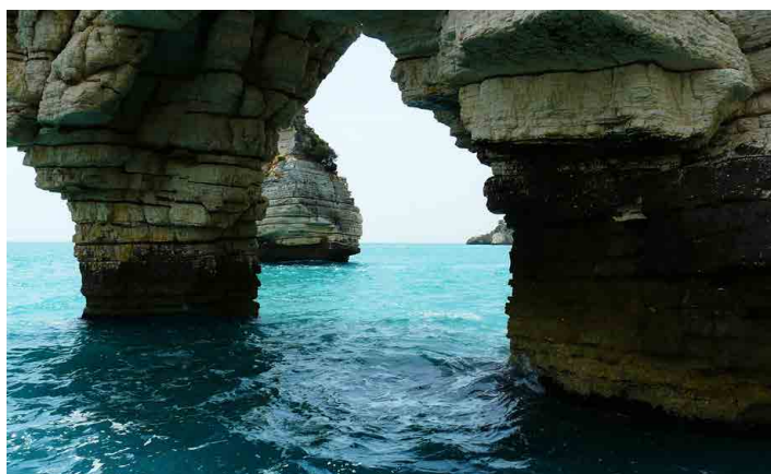
Vodou vymleté skalní tunely mezi městy Vieste a Peschici.