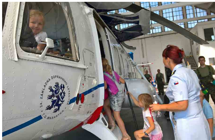
Děti ze Mšena navštívily kbelské vojenské letiště.

Žáci 6.A si prodloužili pobyt ve škole o páteční večer s přespáním. Po zabydlení a přípravě míst na spaní proběhla komentovaná prohlídka školy s výstupem na ochozy u věžičky. Pak byla na školním hřišti odehrána utkání v softbalu a vybíjeně. Než se setmělo, tak si žáci opekli buřty a jiné dobroty a zahájili diskusi kroužek v pneumatice. Před noční procházkou po školní budově s hledáním svíček si zatančili při krátké diskotéce, spíše „zajezdili“ na žíněnkách. Pak přišel čas na oblíbenou hru „Městečko Palermo“. S půlnocí se žáci uložili ke spánku, ale prokázali „vytrvalost“ a před druhou hodinou málokdo usnul. Ráno stihli odehrát