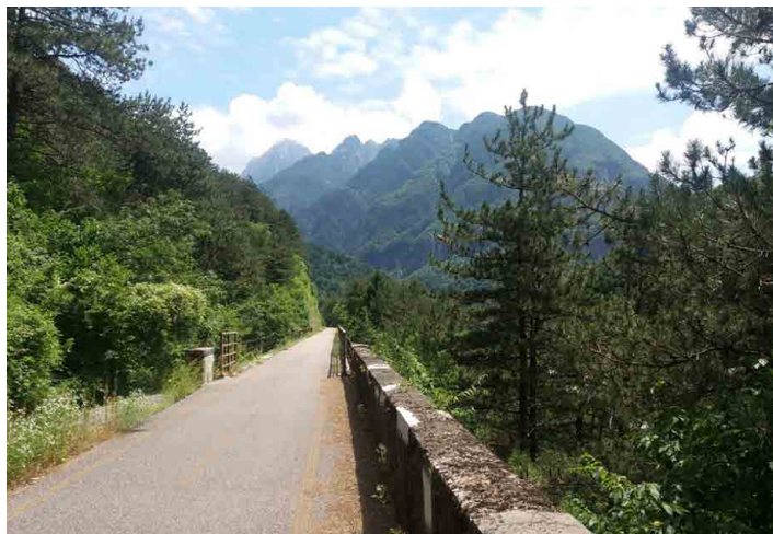
Cestou mšenský cyklista projížděl malebnou krajinou...