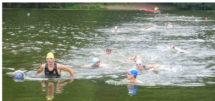
Letos plavcům žádné velké horko nebylo...

6019 Nosálov – Na Fučíkovském 1 km; 6085 Jestřebice – Kostelíček – Šemanovický důl – Klemperka, jeskyně – Truskavenský důl 5,5 km; 6090 Chloumek – Strážnice – Vysoká – Harasov 8,5 km; 6091 Želízky – Dolní Zimoř – Sítne – Dolní Vidim – Osinalice – Nedvězí, rozc. 18,5 km (Nedvězí, vrchol 0,5 km); 6093 Cinibulkova stezka: Mšeno – Romanov – Prolezovačky – Obraznice, jeskyně – Kačina, rozc. – Vyhličky, rozc. – Nad Studáneckou roklí – Bludiště – Švédský val – Obří hlava a Žába – U Faraona – Mšeno, koupaliště – Mšeno 9 km; 6095 Nad Studáneckou roklí – Bludiště, východ – Ráj – Olešno – Zbrázdný vrch – Kamenný úl, jeskyně – Střezivojice 10,5 km; 6110 okruh kolem Hradska: U Grobiána, host. – Kočičina, pod Hradskem – Hradsko – U Grobiána, host. 3 km; 6145 Kolo – Hostín – rozc. U zemljanek 5 km; 6149 Pšovka, autokemp – Mělník, aut. st. – Mělník, žst. – Bílé břehy, rozc. – Skalní byt – Lhotka, žst. 8 km; 6958 Zakšín, bus – Pustý zámek – Rač – Panenský hřeben – Nedvězí, vrchol – Dražejov – Dubá 12,5 km. (www.mestomseno.cz)