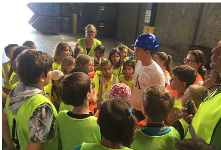
Mšenští školáci obhájili první místo ve sběru hliníku.