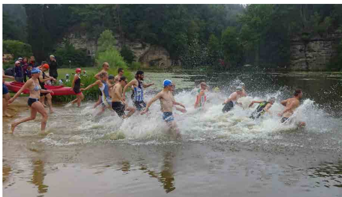
Kokořínský triatlon začíná tradičně na Harasově.

Letos byl vzduch studenější než voda a netuhly jen nohy, ale celé tělo. Nejednomu při převlékání z plavek do cykloresu naskakovala husí kůže. Jízda na kole při triatlonu