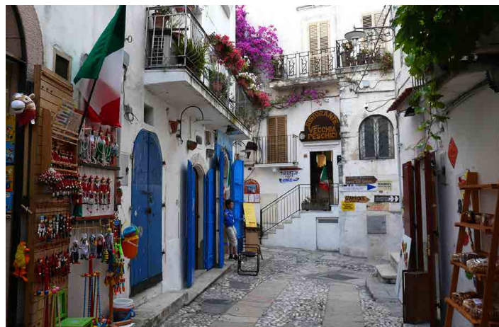
V Peschici jsou k vidění malebné obchůdky.

Postupně procházíme řadu úzkých uliček mezi poměrně vysokými domy, nahoru a dolů po schodištích a všude se nám otevírají krásné pohledy na další části po okolních kopcích rozloženého města. Asi nejznámějším zdejším objektem je velká kuželovitá skála z bílého vápence, vyčnívá z mělké pobřežní vody. Jmenuje se Pizzomuno a hned vedle stojí podobná skála, ještě ne zcela oddělená od skalního bloku. Navštívili jsme taky několik malých obchůdků se sýry, zděššími uzení-