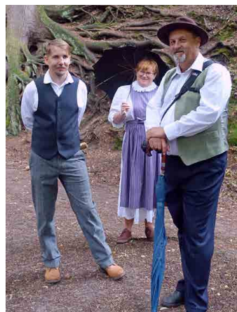
Během vycházky došlo na několik scének.