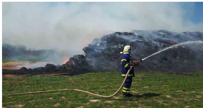
K požáru stohu vyjžděli mšensští dobráci i mělničtí profíci.

Podle velitele družstva Patrika Vyskočila mezi zajímavější zásahy patřila například záchrana dětí, které na začátku letošního ledna lezly ve mšenských Bílkách po skalách. „Na místě jsme zjistili, že jsou pod