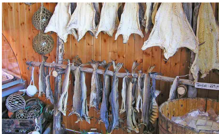
Nasolené sušené ryby patří mezi místní specialitu.