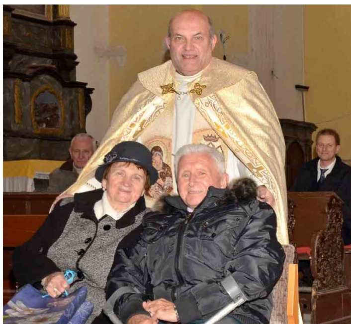
Manželům Dvořákovým požehnal páter Leopold Paseka.