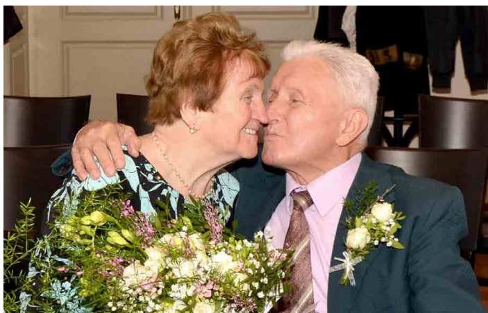
Dvořákové si řekli své ANO před 60 lety v Chorušicích.

Dvořákové prozradili, že i když doba na konci padesátých let církevním obřadům nepřála, byl