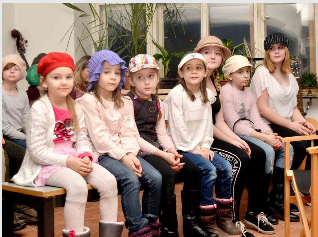
Lidé, kteří si nenechali ujít únorový Večírek kumštýřů ve mšenské restauraci U Pokliček, se během večera dočkali i vystoupení mladých herců z Dětského divadelního studia Mšeno. ...4