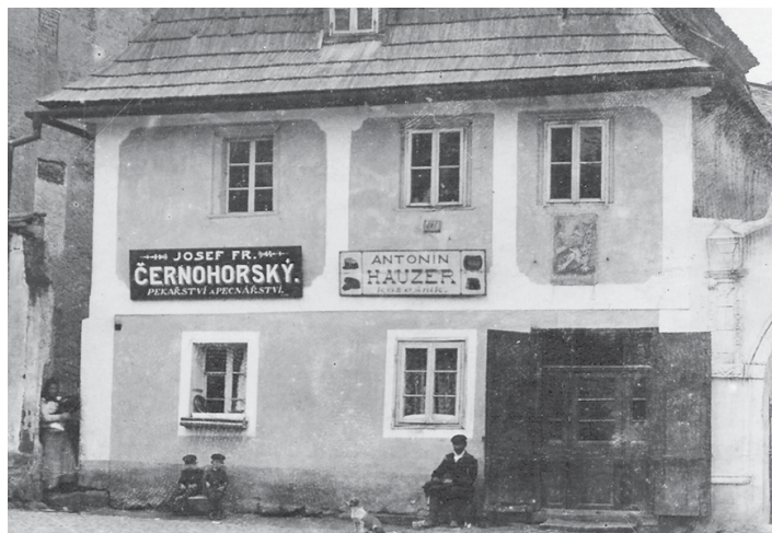
Při pátrání po předcích pomohou i staré fotografie.

Ale popořadě. V literatuře se můžete setkat se třemi termíny – rodokmen, vývod a rozrod. Co tyto termíny znamenají? První jmenované slovo je nejvíce známé a mnohdy užívané laiky všeobecně pro jakékoli vyhledávání předků. Ve skutečnosti se ale jedná o dohledání předků výchozí osoby po otcovské linii. Tedy otce, děda, praděda a dále, až do hluboké minulosti. Naopak vývod zahrnuje všechny předky výchozí osoby, nejen ty mužské, ale i ženské. Právě tento druh genealogického bádání bývá graficky znázorněn v podobě rozvětvených stromů. Základnu tvoří výchozí osoba