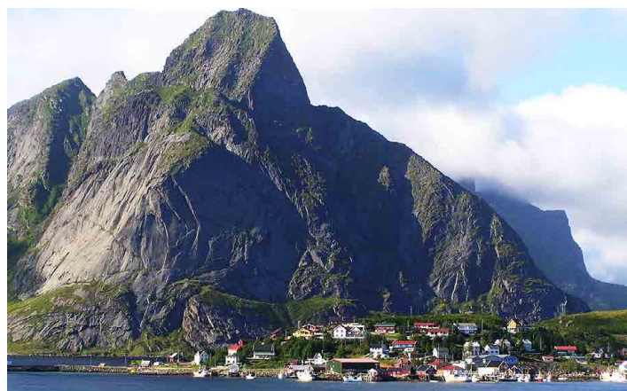
Městečko Reine leží na úpatí obrovské skály.

Poslední ostrov, na který musíme přejít po mostě, je nejjižnější, z těch čtyř nejmenších a také nejkrásnější. Strávíme na něm dva dny. Jmenuje se Flakstadoy. Prošli jsme dvě nádherná městečka Reine a přístav Mos-