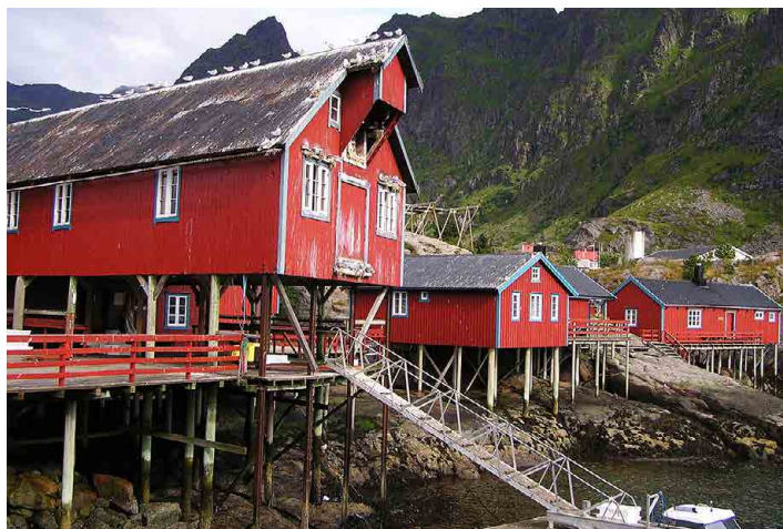
Původně rybářské domky stojí většinou na dubových kůlech.

Do posledního městečka Moskenes jdu s několika kolegy asi hodinu pěšky, z pobřežní cesty máme nádherné výhledy. Jsme na místě, autobus také, nalodujeme se a po dvou hodinách na pořádně rozbourěném moři přistáváme na norském pobřeží. Shodujeme se, že Lofoty jsou asi to nejhezčí, co jsme kdy navštívili. Kdo nevěří, ať se tam vypraví. A ještě poslední věta. Podle místních zde jenom tři dny v roce neprší, nám to vydrželo čtyři dny. Zdeněk Bergl