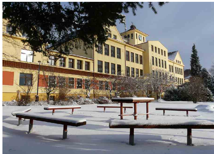
Investice do základní školy měly podle odborníků význam.

Situace ve skutečnosti ale není tak černá a v posledních letech se výrazně mění k lepšímu. Jsou to právě obce a města jako Mšeno, jež k tomu přispívají tím, že realizují projekty, kterými reálně zlepšují