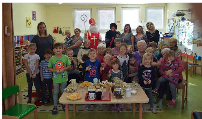
Na nadílku se přišly podívat i „školkové babičky“.

Na mikulášskou nadílku se přišly podívat i „školkové babičky“. To jsou babičky z okolních obcí, o které se stará pečovatelská služba obce Chorušice. Místo pytle s neplechou přinesly babičky koláče a sladkosti