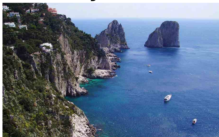
Faraglioni ze sedla mezi vrcholy Capri a Anacapri.

Celý vápencový ostrov vyzvednutý v dávných dobách ze dna poměrně mělkého moře je provrtán několika od mořského příboje vyhloubenými jeskyněmi. Názvy dostaly podle barvy vody v nich. Tu způsobuje hloubka vody a také složení dna. Vplouváme do Grotta Verde a Grotta Bianca, to znamená Zelená a Bílá jeskyně. Za chvíli se před námi objevuje dominanta ostrova, tři špičaté skalní bloky vystupující blízko pobřežních skal. Jmenují se Faraglioni a obloukem v prostředním z nich proplouváme. Nádherna! Asi po hodině se dostáváme k té nejslavnější jeskyni, Grotta Azzurra. Tam by velký člun