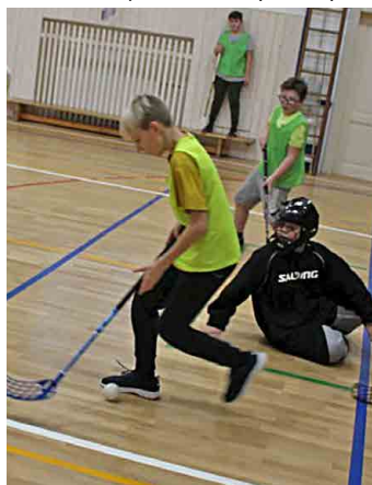
Školáci hráli jako o život...

Starší (8. - 9. ročník) - Za účasti pěti týmů proběhly souboje o vítězství mezi nejstaršími žáky a žákyněmi.