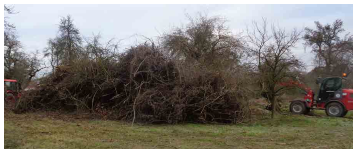
Z větví se stane štěpka, která poslouží k vytápění školy.

Pokácený materiál, po dohodě se starostou Mšena, pracovníci města svázeli na obrovskou hromadu, aby byl lepší přístup pro další zpracování. Tam budou větve a křoviny