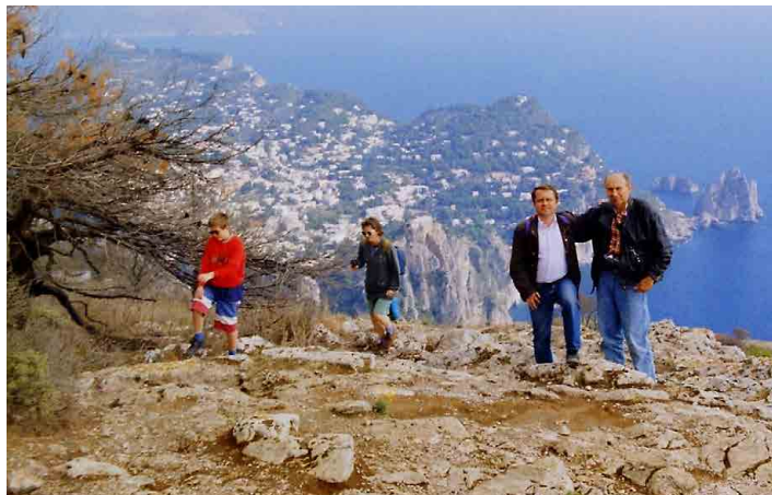
Pohled z Monte Solaro na Faraglioni a vrchol Capri.