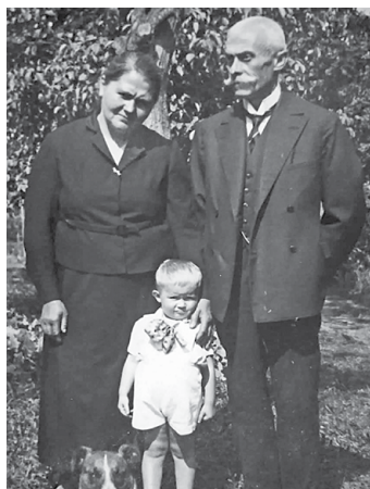
Deděček E. Černožorské se svými prarodiči.

Jak jsem uvedla v první otázce, prvopočátek mého bádání byl zaměřen především na Habsburky. Jelikož jsem dětství prožila v jihočeském Táboře, stranou nežstál