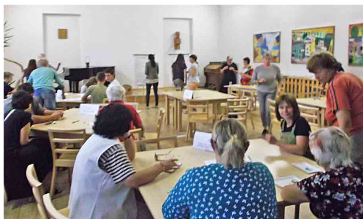
Desatero problémů města Mšena se koná každý rok.

V rámci následné ankety hlasy ostatních obyvatel podpořily všechna témata, která v rámci konaného fóra dostala hlas v sále. V rámci ankety je pro občany prioritou ze-