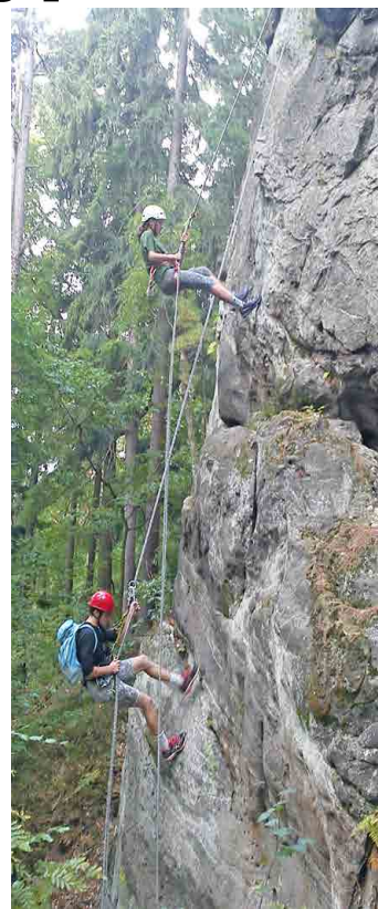
Mšenským lezcům se na závodě dařilo.