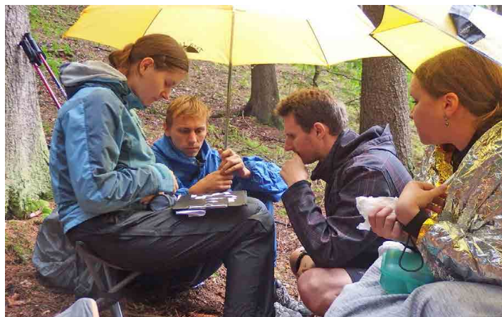
Soutěžící, kteří si doma nezapomněli deštník, udělali dobře.

O co jde? Základním principem hry je luštění šifer. Týmy složené ze dvou až pěti hráčů postupně pěšky procházejí kontrolními body - stanovišti. Na každém stanovišti tým obdrží zadání šifry, jejímž vyluštěním získá informace o poloze dalšího stanoviště. Takto postupně projde celou trasu hry. Tým s nejvíce