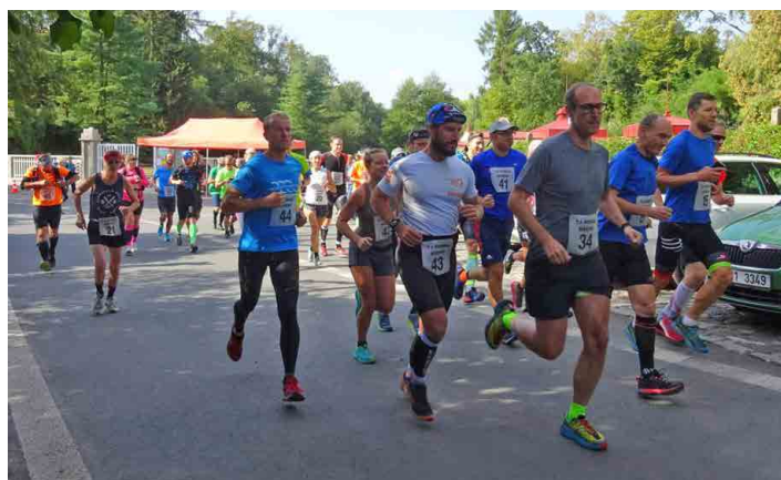
Sportovci startovali od mšenského koupaliště.

První tři kilometry závodu byly opatrnější a drželo se pohromadě osm mužů. Teprve více než dvouki-