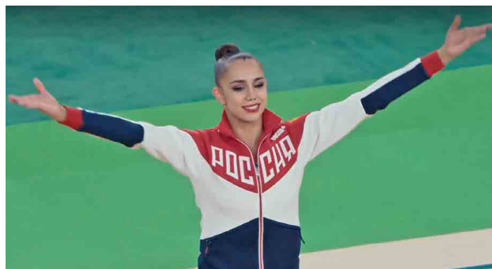
Říjnové promítání přiblíží sport v Rusku.