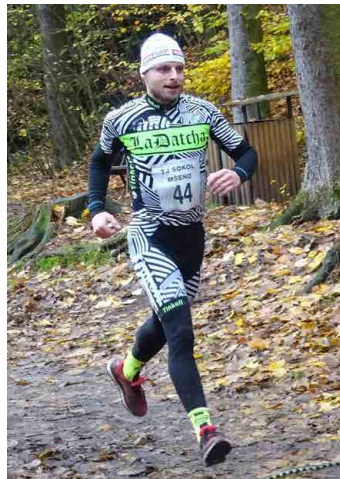
Sportovci poběží Debrí.

Ve stejnou hodinu, úderem desáté, na začátku mšenského lesoparku Debr' odstartuje už tradiční přespol-