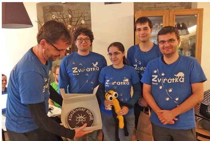
Letošního Kokořínského komára ovládla Zvířátka.