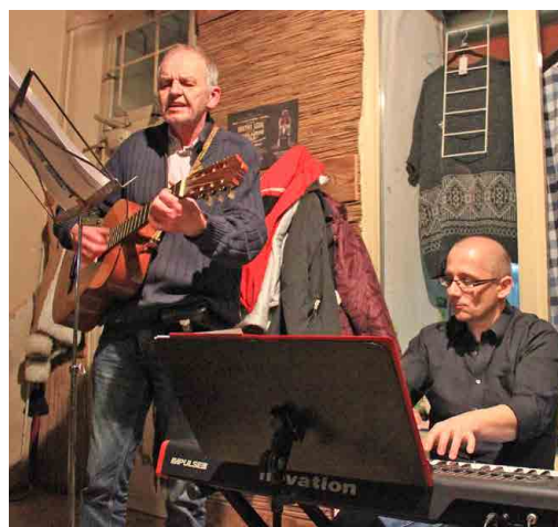
V sokolovně se představí skupina Prague BuskMen (zleva) i partička Fanta (je) Bidlo. Foto: Jiří Říha (2x)