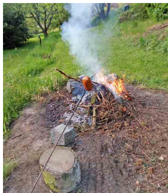
Je libo buřtík?

Když už si ze mě začali dělat přátelé legraci a pořád se mě ptali, jestli už jsem tam spala, tak jsem si řekla, že to zkusím. Všechno jsem předem promyslela, vybrala si strategicky lepší stranu postele – tam na mě vrah nedosáhne, koupila svíčky, připravila slzný plyn a prášky na spaní. Už během dne mi náhoda