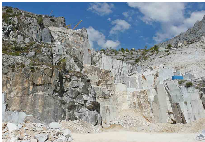
Lom Fantiscritti patří k neznámějším.

Nejkvalitnější mramor se ovšem těží uvnitř hory. Tam jedeme v mikrobusech 600 metrů dlouhým tunelem a dostáváme se do obrovského a vysokého prostoru. Zde se už neteží, podpírá ho několik asi pět metrů širokých sloupů, které brání zřícení