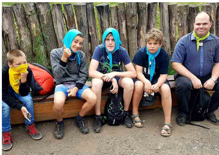
Na Zlatou včelu vyrazili čtyři mladí včelaři.

historií včelaření z různých úhlů pohledu. Dozvěděli se o známých osobnostech, které měly vliv na včelaření i na Mšensku. Vyzkoušeli si pokusy se včelařským vybavením, které se vyvíjelo zejména v minulém století. Také ochutnali včelí med ze včelařského kroužku.