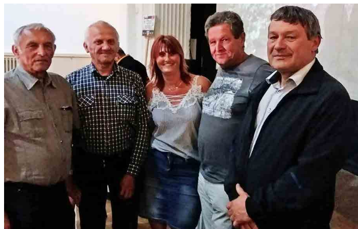
Do Mšena dorazily legendy motocyklových soutěží.