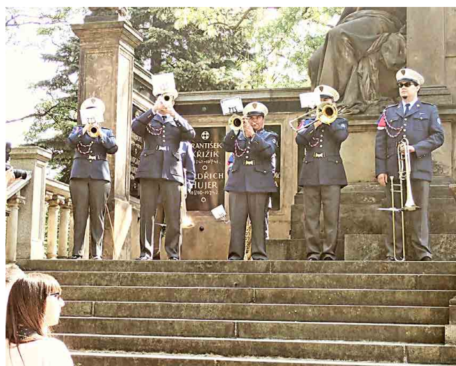
Schody na Slavíně obsadili trubači Hudby Hradní stráže a Policie ČR.