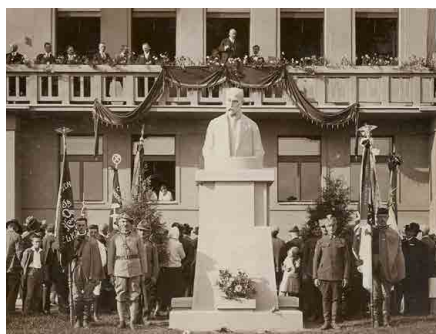
Slavnostní otevření školy se konalo 2. září 1928.