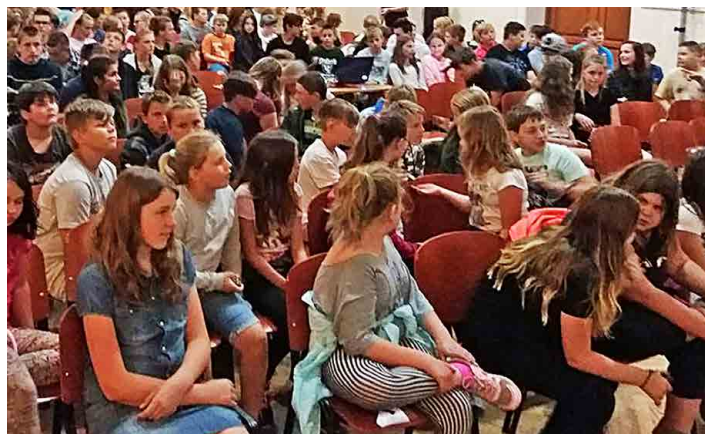
Za závodníky do sokolovny přišlo na sto šedesát školáků.