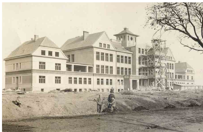
Masarykova škola byla ve své době opravdu monumentální stavbou.

Mnozí z nich, dnes už často v rolích rodičů a prarodičů, se do své školy mohou vrátit a zavzpomínat na školní léta 9. června, na kdy jsou plánovány oslavy devadesátilet od otevření školy.