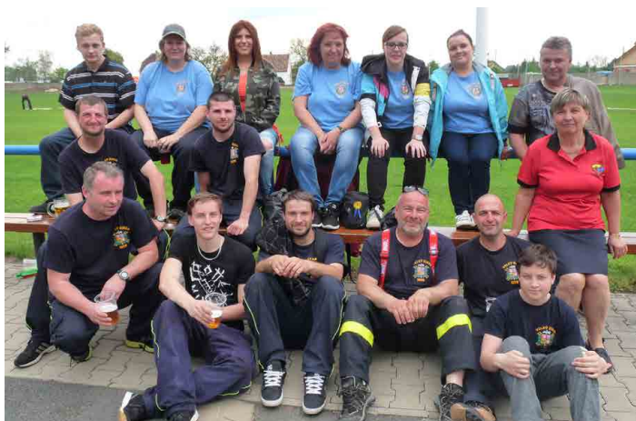
Újezdští hasiči mají jeden z nejstarších sborů v okolí.

Byl to sbor dobrovolných hasičů, který inicioval v roce 1923 výstavbu pomníku padlých v I. světové válce, pomník slavnostně odhalen v roce 1929. Dlouhodobý problém s nevyhovující hasičskou zbrojnicí byl vy-