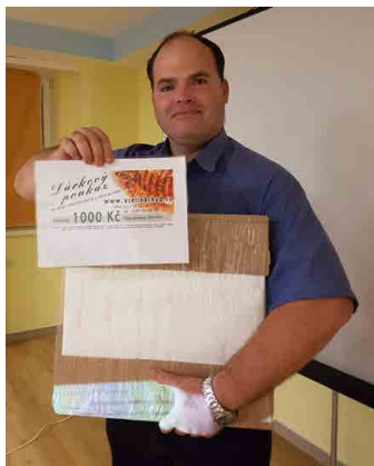
Cenu převzal vedoucí kroužku.

Po několik let se pravidelně účastníme soutěže „O pohár ministra zemědělství“. Odborná komise hodnotí práci včelařských kroužků vždy za jeden školní rok. V loňském roce jsme byli potěšeni, že náš mšenský včelařský kroužek dostal ocenění za druhé místo. V říjnu loňského roku pak ceny převzal vedoucí kroužku během školení vedoucích včelařských kroužků mládeže v Praze.