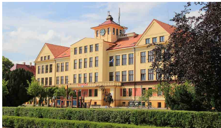
Mšenská škola se před lety dočkala rekonstrukce.

Základní kámen nové školy byl za zpěvu státní hymny položen v úterý 19. října 1926. A už za necelé dva roky - 2. září 1928 se žáci, učitelé