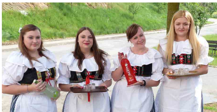
Újezdská děvčata měla připravena něco ostřejšího...

Velký Újezd - Máje mají v Újezdě velkou tradici. Na fotografiích máme možnost sledovat tuto slavnost doplněnou různými scénkami, například v hospodářském dvoře Josefa Šimonka. V meziválečném období se průvod zastavoval u pomníku padlých, v roce 1959 pořádala Osvětová beseda staročeské máje s průvodem v krojích, scénkou před čp.3 a 4 a večerní taneční zábavou.