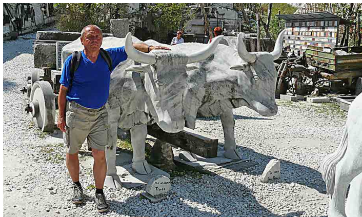
Z mramoru je vytesaný i vůz s volským spřežením.