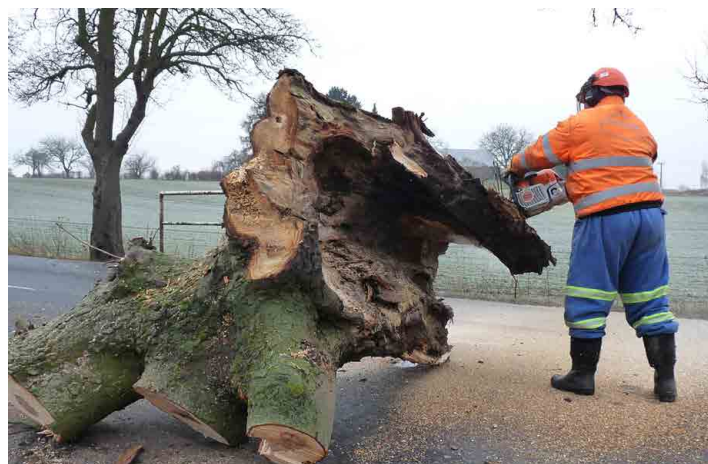
Smutný osud potkal i mohutný kaštan, byl také vyhnulý.