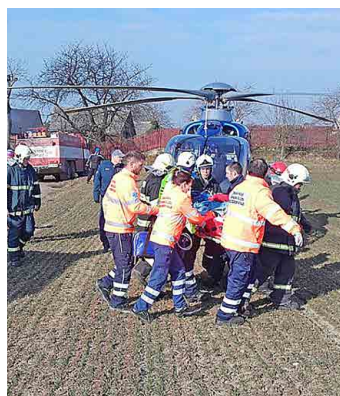
Na poli u Sedlce přistál vrtulník pražských záchranářů.

Hasičům a záchranářům si zavalený dělník stěhoval na bolest