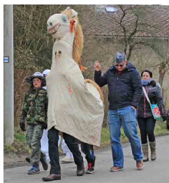
Kobyła nescházela.