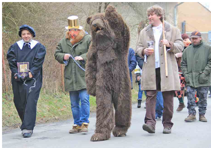
Středem pozornosti byli jako vloni medvěďár s medvědem.