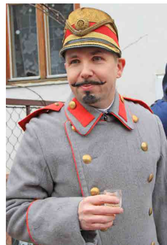
Nechybělo něco na zahřátí...