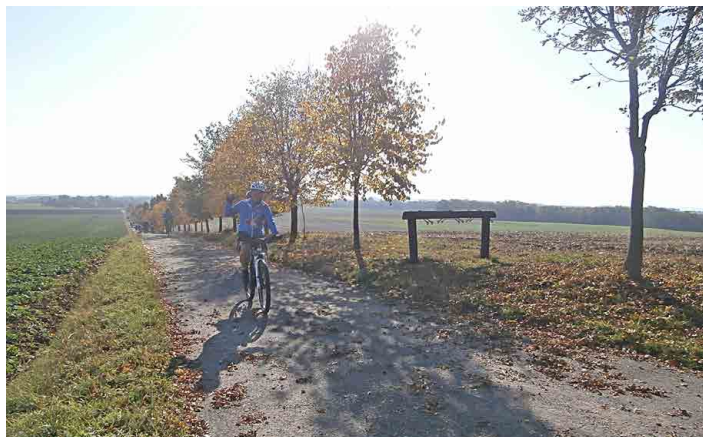
Kadlínské aleje v okolí rozhledny lákají mnoho turistů.

Dva největší biokoridory o celkové výměře necelých dvou hekta-