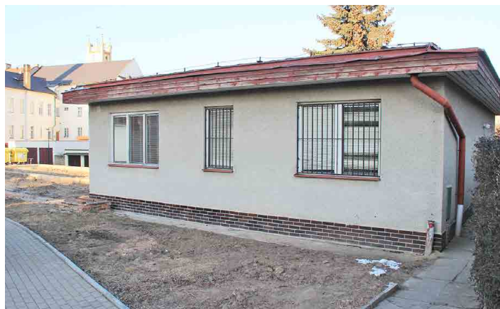
Po demolici zůstala část střediska stát, čeká ji oprava.

Po zbourání spodního sídla lékárně zůstala stát část bývalé lékárně, kterou chce město využít. Ta totiž nebyla postavena z dřevěných fošen, hobry a sololitu. „Jde o zděnou stavbu, která má stabilní základy a je dokonce podsklepena. Pokud bychom ji chtěli zdemolovat, nevyhnuli bychom se dalším nákladům na sanaci svahu a navíc bychom ohrozili sousední pozemek, který město před lety tak nešťastně prodalo na stavbu soukromého domu. Proto jsme se rozhodli, že bývalou lékárnu využijeme,“ řekl Martin