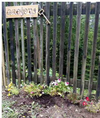
Zachráněné květiny zdobí prostor před plotem.

Když přijedeme na chatu po větřném počasí, máme stuhu z věnců a