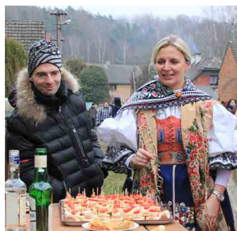
Dzikovi přichystali samé dobroty.

Noviny pro město Mšeno a okolí ▪ Vydává MěÚ Mšeno od roku 1995 ▪ Vycházejí v nákladu 600 ks na začátku měsíce ▪ Redakční rada: Jiří Říha (jř) - šéfredaktor, Karel Horňák (kh), Vladislava Kaulerová Vaňková (vkv) ▪ Grafická úprava: Jiří Říha ▪ Kontakt: msen-sko@email.cz, telefon: 737 671 196, pošta: Husova 149, 277 35 Mšeno ▪ Uzávěrka příspěvků je vždy 20. den v měsíci ▪ Redakční úpravy vyhrazeny ▪ Tisk: K-Tisk ▪ Cena za výtisk je 10 Kč včetně 10 % DPH ▪ Povoleno Ministerstvem kultury ČR, reg. č. MK ČR E 10701