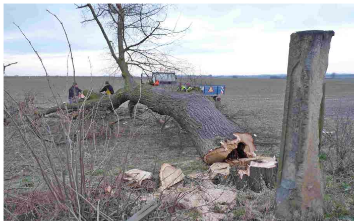
Poslední ze tří starých lip připomíná už jen dutý pařez.

Tři lípy „U křížku“ byly památnými stromy ještě na počátku tohoto milénia. Ze soupisu památných stromů z roku 1941, který vytvo-