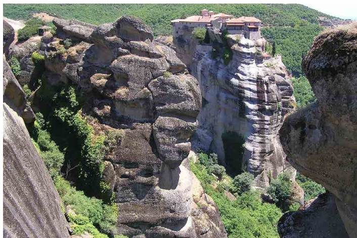
Celý vrchol skalní věže zaplňuje klášter Varlaam.

středek do kláštera. Z dřevěné budky, vysazené asi dva metry mimo kolmou skálu, se přes velký rumpál na lidský pohon mniši spouštěli dolů, stejnou cestou se dostávali nahoru. Museli přitom vlézt do sítě ze silných provazů a spoléhat na to, že je ti nahore udrží. Stejně sem dopravovali veškerý materiál. Než ale postavili tento důmyslný systém dopravy, museli všechno vynášet na zádech jako horolezci pomocí zajištěných lan. Odměnou za ohromnou námahu jim byl pocit, že jsou v těchto výškách blíže k Bohu a mají ničím nerušený klid k meditacím.