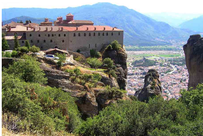
Velký komplex Agios Stefanos zaplňují mladé jeptišky.

Jdeme se ještě podívat na skalní vyhlídky, koukáme na několik dalších klášterů. Přímo proti nám zaplňuje celý vrchol skalní věže klášter Varlaam, pod ním nejmenší Russanu a v dále další velký komplex Agios Stefanos, tam se zajedeme podívat. Tentokrát můžeme parkovat přímo před klášterem, prostor tu mají dostatečně veliký. A taky nemusíme nikam šplhat, klášter stojí na okraji velké skalní plošiny. Z vnitřních prostor se dostaneme jen do kostela a prodejny suvenýrů. Klášter je ženský a ostat-