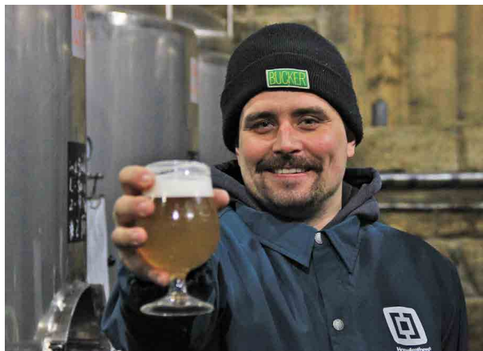
Pivo je Václavovým nejoblíbenějším nápojem.

Začít vařit pivo není podle Vaška Kopeckého nijak finančně náročné, tedy alespoň v malém měřítku. „Hrncem se někde sežene, chladič jsme s