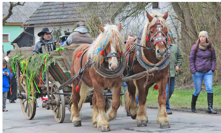
Harmonikáři vyhrávali z vozu taženého dvěma chladnokrevníky.