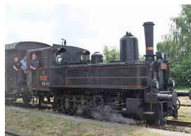
Bude i pára...