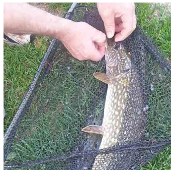
Rybáři měli co lovit...