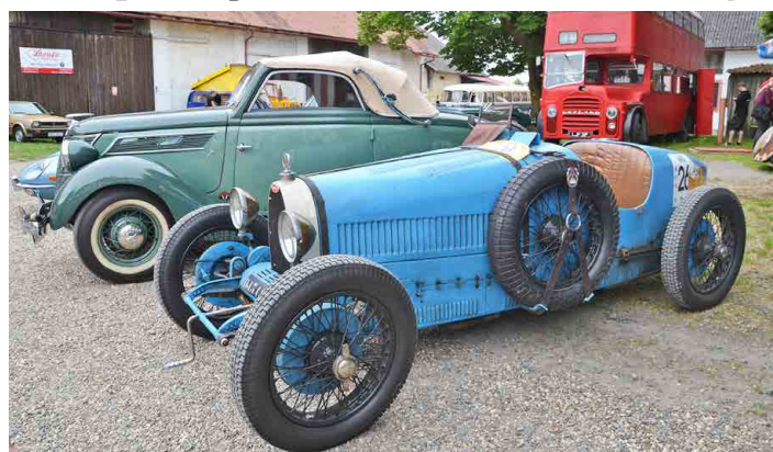
Návštěvníci Lobče uvidí řadu zajímavých vozidel.

Letošní ročník je s podtitulem „Zpátky do Kokořínska a jeho okolí“, kdy se znovu vydáme do známých míst, ale také méně známého okolí - více nemůžeme prozrazovat - opět se pojedou podle