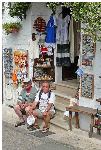
V řadě domků jsou obchůdky.