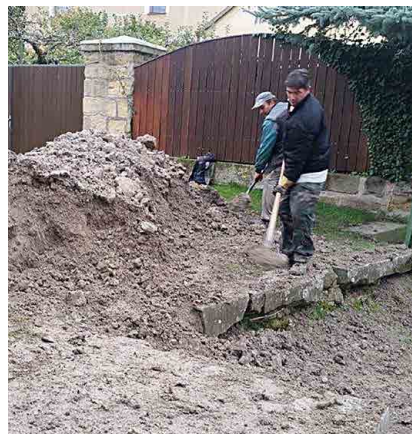
Rybáři na stavbě odpracovali přes dvě stě hodin.

Stavební materiál jsme zakoupili v místních stavebninách, dopravu písku a později jílu pro utěsnění