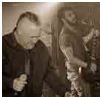
Večer zahraje V-Rock.