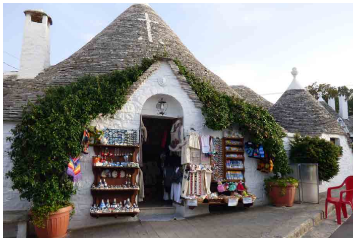
Ve vesnici je přes tisíc malých kamenných domků.

Alberobello, vesnice s více než tisícovkou malých kamenných domků, vznikla při osídlování oblasti pod vedením hrabat z rodu Conversaro ve druhé polovině 16. století. Malé domky, zvané Trulli, stavěly z místního tmavého vápence bez použití malty. Více než metr silné zdi tvoří naskládané kameny do výšky necelé dva metry, na ně pak navazuje z plochých desek postavená kuželová střecha, za-