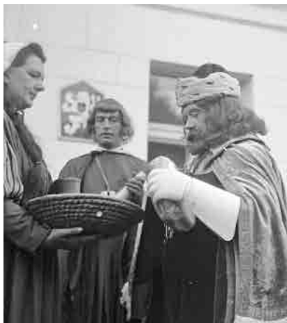
Fotografie z 600. výročí města budou k vidění na radnici.