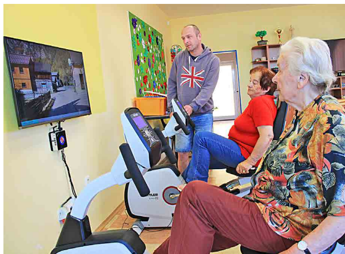
Mšensští senioři už používají interaktivní rotopedy.

jen tak bezmyšlenkovitě jako na běžném rotopedu, který stojí někde u zdi. Interaktivní rotopedy jsou připojené k obrazovce, na níž probíhají různé cyklistické trasy