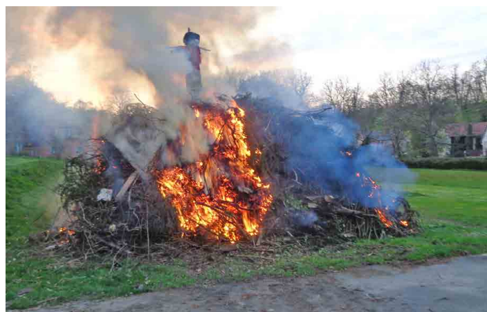
Po vztyčení májky došlo na upálení čarodějnice.

Po dlouhých letech došlo v květnu na obnovení zaneseného pra-