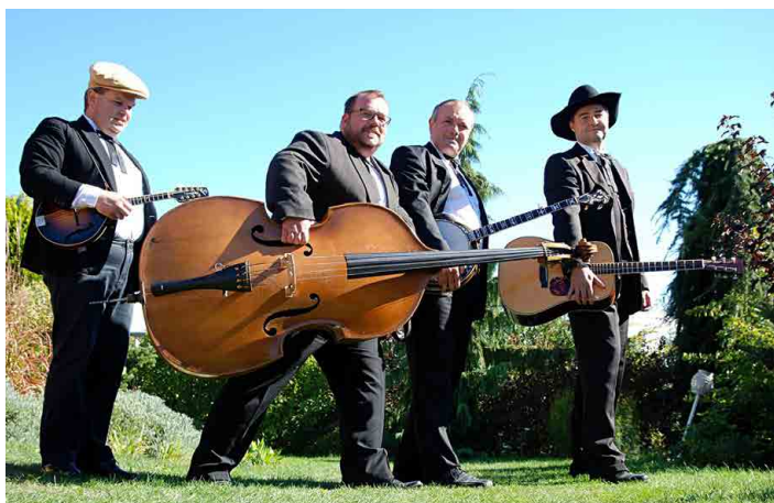
Novinkou Plovárny letos bude skupina Sunny Side.

Letošní velkou novinkou je rozšíření občerstvení v podobě stánků pivovarů. Jeden z nich si vezme na starosti nedaleký Pivovar Lobeč, další Pivovar Kunratice a Pivová-