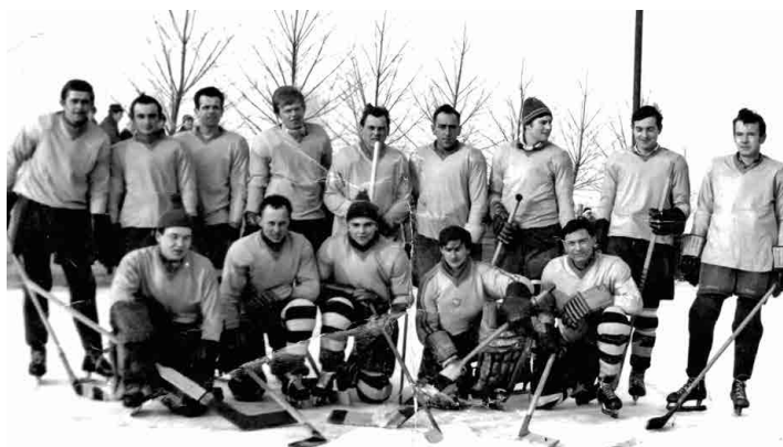
Mšenský oddíl ledního hokeje v roce 1964.