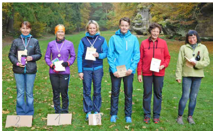
Vyhlášení vítězů se konalo na louce na začátku Debře.