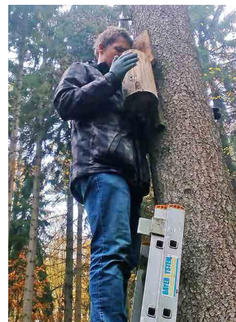
Bylo vyčištěno celkem dvaadvacet budek.

Za spolupráci děkují Jaroslavu Kopeckému z Kralup nad Vltavou, své dceři Anně Skopcové a rovněž