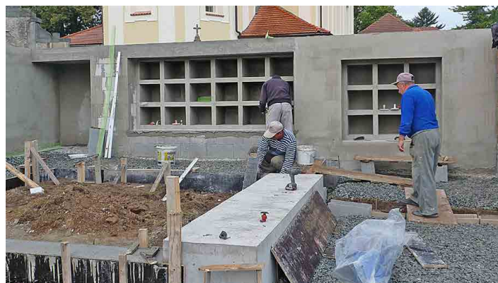
V kolumbáriu je nyní bezmála sedmdesát míst.

„V posledních čtyřiceti letech lidé nejvíce využívají urnové pomníčky nebo urny umístující právě do kolumbária. Dvojhrobů tu od doby vybudování takzvaného nového hřbitova vzniklo jen asi pět a jednohrob pouze jeden, jinak se samozřejmě pohřbívá do starších hrobů a hrobek na starém hřbitově,“ vysvětlil starosta Chorušic