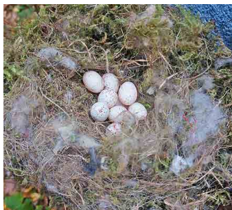
V jedné budce zůstalo osm opuštěných vajčiek sýkorky.

a to v Hlovci, Debři, v parku před základní školou a ve Františkově aleji. Tam je technický stav ptačích obydlí nejhorší. Někde chybí stříška, jiné jsou zcela zničené.