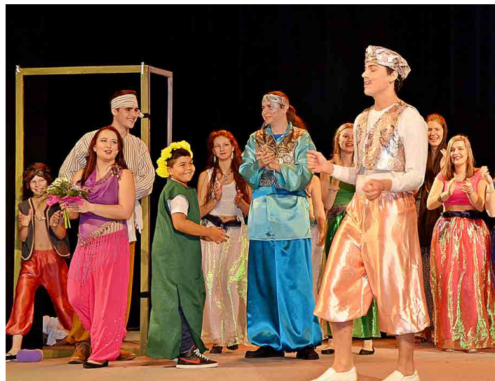
V nové zpěvohře Šeherezáda hraje zhruba pětadvacet herců.

Šéfová Nového divadla chce Šeherezádu přihlásit i na přehlídku do Rakovníka, kde se prý Mělnickým nikdy nedařilo. „Je jasné, že nás tam zase pohaní, což je tam zvykem, ale z toho si nic neděláme a zase se tam přihlásíme. Ale až na příští rok, abychom doplňovali, co bude třeba, a byli jistější. V Rakovníku jsou bohužel s hodnocením stále na úrovni Maryši nebo Lucerny. A my máme už úplně jiné divadlo, které prostě porotci nechťejí pochopit. U Libushe nám řekli, že ji máme hrát akorát tak na sálech a v sokolovnách. My ale v těch sokolovnách hrajeme rádi,“ řekla spokojeně divadelnice.