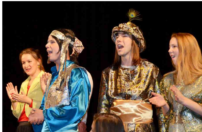
Herci Nového divadla na přehlídce excelovali.

Na prknech, která znamenají svět, mělničtí divadelníci Šeherezádu představili zatím čtyřikrát. Premiéru měli v domácím Masarykově kulturním domě v lednu, pak svým novým kusem potěšili diváky v Libochovicích, Louňovicích, v