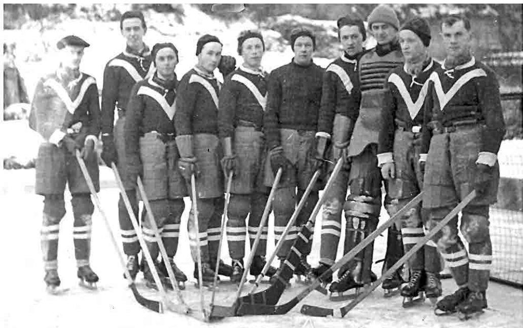
Jedna z prvních fotografií mšenského hokejového týmu, která vznikla krátce po založení klubu v roce 1941.

Hokej získal v krátké době řadu příznivců a značné obliby v celé mšenské veřejnosti. Hřiště bylo v krátké době přemístěno na „Jezero“, kde byly daleko příznivější