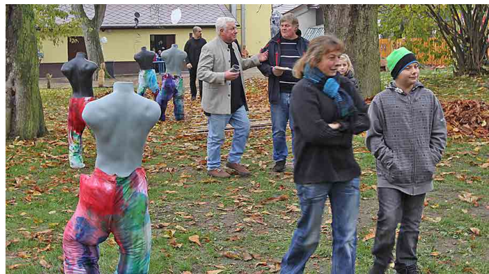
Školní zahrada se otevřela návštěvníkům.

Svatomartinskému koncertu pro Světlušku však předcházela ještě jedna akce, jež byla hodna pozornosti.