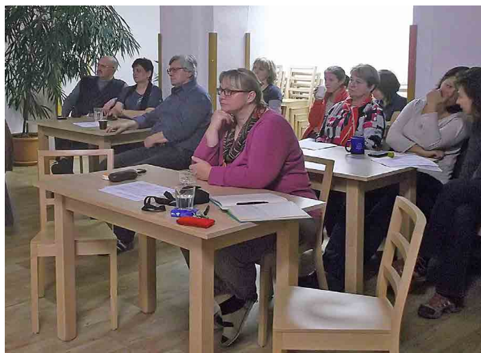
Setkání se zúčastnilo pouze čtrnáct obyvatel Mšena.

Limitem pro využití je poloha pozemku a stávající okolní zástavba, jako je kostel a několikapatrová bytovka. Z této místní dispozice