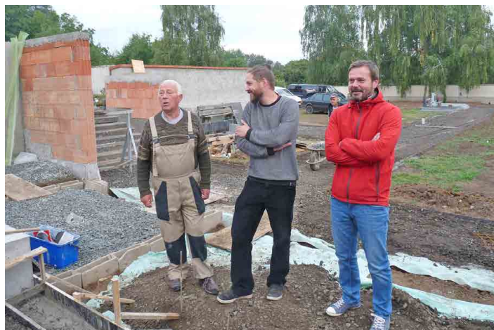
Rekonstrukce se dočkalo nejen kolumbárium, ale i celý „nový“ hřbitov.

V lednovém vydání Mšenska najdete na čtyřech stránkách podrobný jízdní řád vlakových i autobusových spojů.