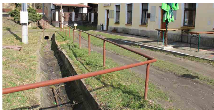
Kadlín bude upravovat kanál ve spodní části obce.

majiteli pozemků v k. ú. Ledce budou usilovat o vypracování a realizaci Komplexních pozemkových úprav.