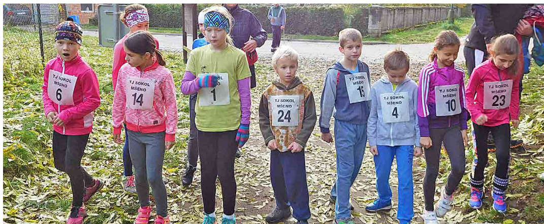
Malí závodníci běželi k lesnímu divadlu.

Mšeno - Už od roku 2004 na každého 28. října, kdy si připomínáme vznik samostatného Československa, pořádají mšenští sokolové Běh Debří. Říká se, že třináctka je nešťastné číslo. To však nemohu potvrdit.