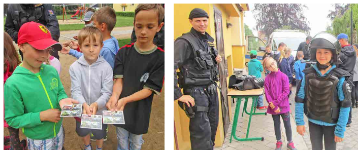
Školáci si den s hasiči a policisty skvěle užili.

Děti si prohlédly hasičská auta, jednotlivé přístroje a nástroje, techniku. Hasiči všem ochotně a dopodrobna popisovali, k jaké činnosti se který nástroj používá. Všichni si dokonce mohli vylézt na střechu hasičského auta, nebo volně loženými hadicemi zkusit hasit. Policie nám ukázala jak techniku na kolech - policejní auto a čtyřkolku, tak závažné prostředky - vesty, helmy,