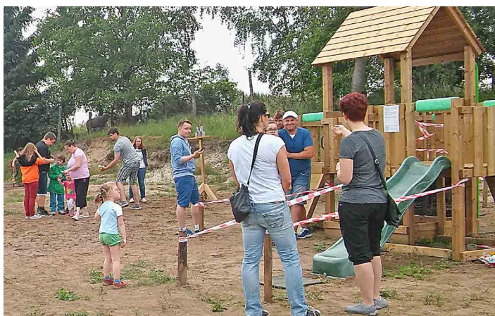
Děti se mohly vyřádit na několika herních prvcích.

Závěrem bych chtěl poděkovat všem, kteří se na akci podíleli, dále všem zúčastněným a hlavně všem sponzorům, kteří pomohli vykouzlit úsměvy na dětských tvářích. Letos to jsou: Myslivecké sdružení Nosálov, Honební sdružení Nosá-