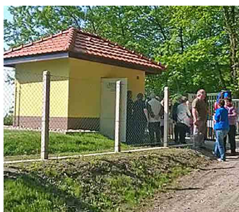
Zbrusu nový vodojem si prohlédla řada lidí.

Realizace stavby probíhala od června 2015 do listopadu 2015. Generálním dodavatelem stavby byla firma PITTNER Česká Lípa s. r. o. Obec jako investor stavby vynaložila na výstavbu vodojemu