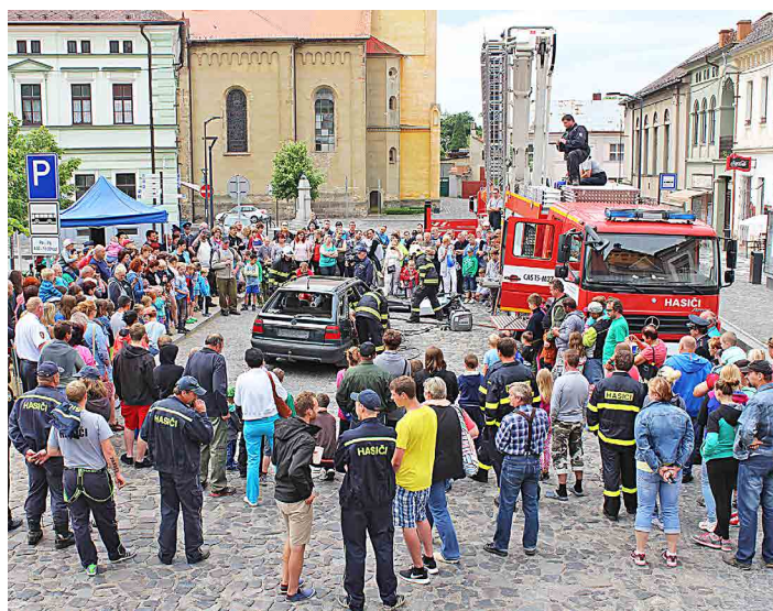
Návštěvníci shlédli ukázku vyproštění osob z vozu.