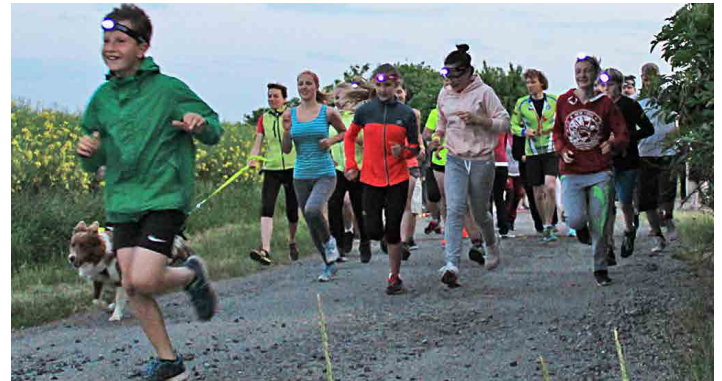
K větrnému mlýnu se rozběhli malí i velcí účastníci.

„Je mnoho různých charitativních běhů, ale nás nejvíce oslovila Světluška. Smyslem běhu je běžet potmě. Nevidomí také nevidí nic jiného než tmu. Čekali jsme proto na setmění a na cestu jsme si svítili čelovkami od Světlušky. Prvních dvacet přihlášených je dostalo zdarma, ostatní si je mohli koupit nebo si