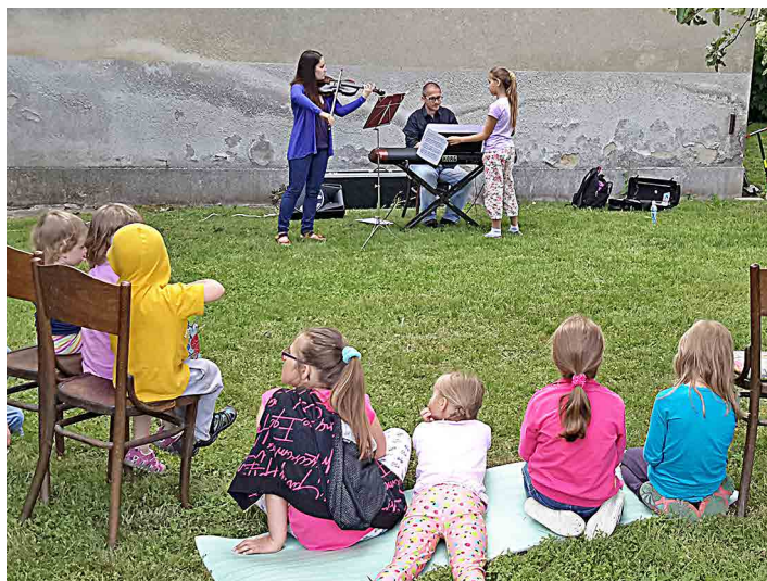
Děti tiše poslouchaly hudební vystoupení.