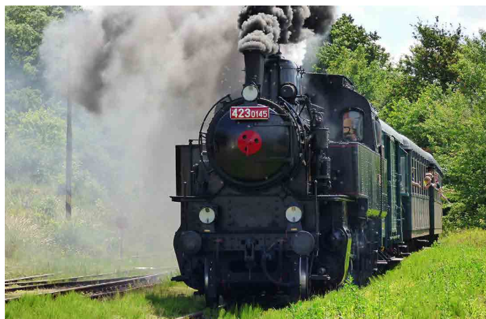
Parní lokomotiva se na Kokořínsko vrátila po dvouleté pauze.

Aby po odjezdu vlaku nebyla na nádraží nuda, mohou se návštěvníci občerstvit u několika stánků, posedět a popovídat se známými nebo jen tak vychutnávat nádherné počasí. Několik stánkařů nabízí ručně