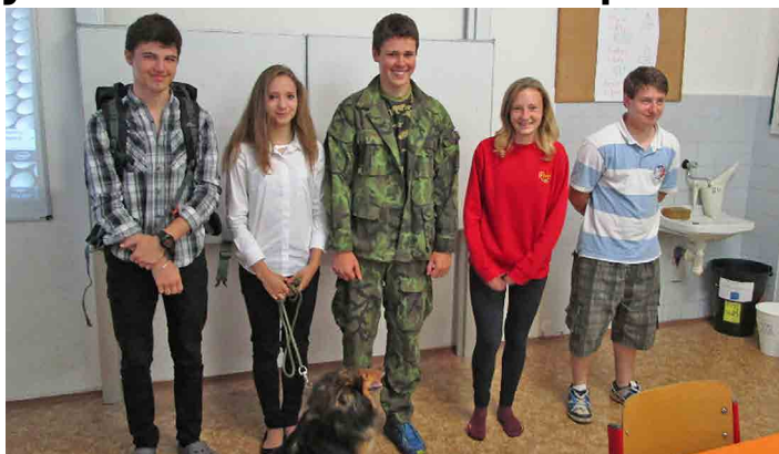
Žáci si na prezentacích dali opravdu záležet.

V letošním roce jsme opět viděli velmi pěkné a zajímavé práce, u zkoušek „nanečisto“ byli přítomni i tři pejsci, prohlédli jsme si výstroj