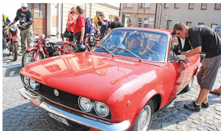
Na Jízdu Kokořínkem vyrazilo bezmála padesát strojů.

A nebyla by to ta pravá Jízda Kokořínkem, na niž jsou všichni zvyklí, pokud by její součástí nebyly záluďné úkoly. „Úkolů je pět. Vedle tradiční jízdy zručnosti, která na účastníky čeká u kokořínského zámku, je to střelba ze vzduchovky na terč, hod míčkem na cíl, určování několika součástek v bedně pohmatem a obvyklé určování záhadných předmětů,“ vyjmenoval před startem jedenáctého ročníku člen mšenského veterán klubu.