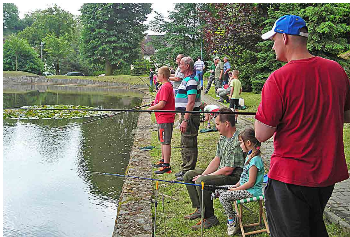
U rybníka ve Stránce se sešlo patnáct malých rybářů.