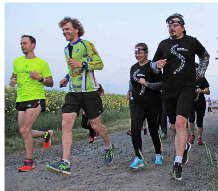
Někteří běžci na sobě měli trika i čelovky od Světlušky.