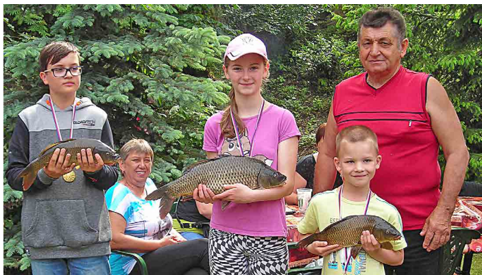
Malí rybáři se mohli pochlubit pěknými úlovkami.

Podle stránceckého starosta Štefana Dvorščíka se na hrázi místního rybníka v sobotu 4. června sešlo patnáct malých rybářů. „Letos ryby braly a rozhodčí každou chvíli slyšeli čísla stanovišť, kde se úspěšní rybáři hlásili o zápis do výsledkové listiny,“ řekl starosta.