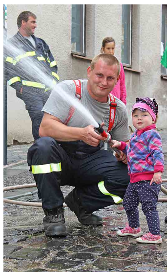
Děti se na chvíli staly hasiči.