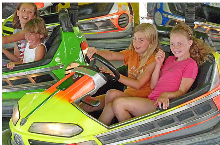
Na Chorušické pouti nebudou scházet atrakce pro děti.

K již zmíněnému výročí poutního místa připravila obec na sobotní den „kousek baroka“, kde si budou moci návštěvníci pochutnat na dobrotách dobové kuchyně, zakoupit ručně vyráběná mýdla, popovídat se členy městské gardy a