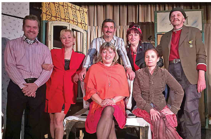
Mšensští divadelníci obnovili Postel plnou cizinců.