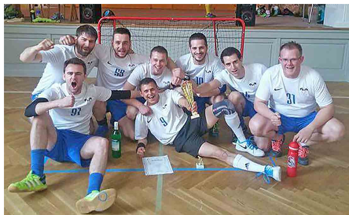
Tým White Flying Rabbits se radoval z prvního místa.