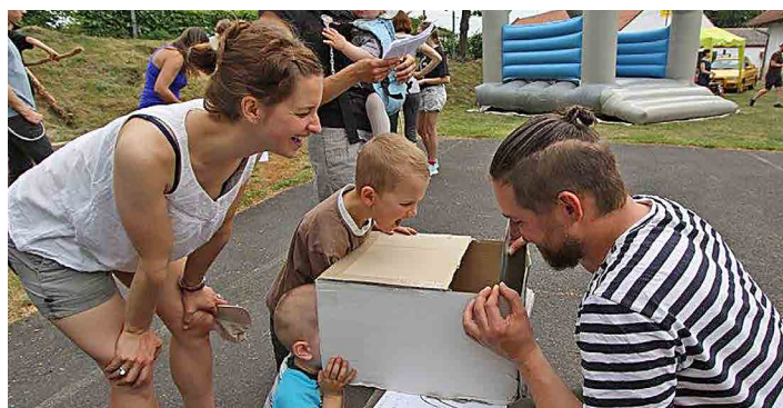
Obec připravila pro děti řadu zábavných soutěží.

Součástí dětského dnu byly i testy zdatnosti a šikovnosti s pěknými cenami. Za tyto ceny, sponzoring a pomoc chci všem poděkovat. Při-