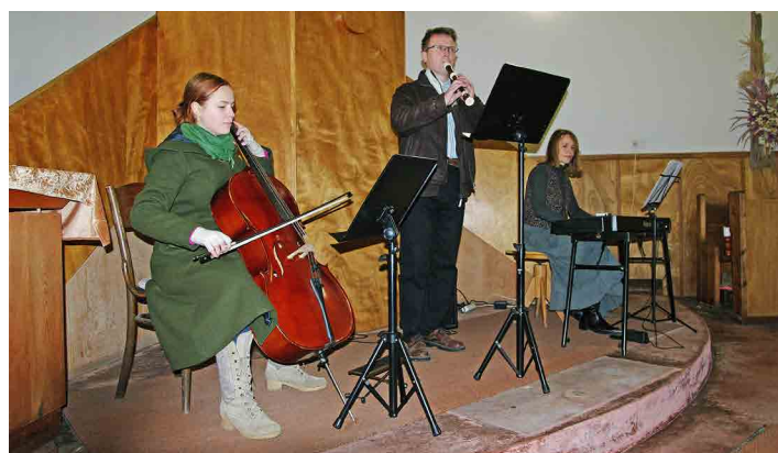
Muzikanti zahráli skladby klasických autorů.

Koncert, který připravil mšenský evangelický sbor za finanční pod-