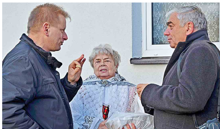
Mšenské baráčky uvítaly hosty místním chlebem a solí.

Obnovení trati Mšeno – Mělník, která se dočkala nových betonových pražců, kolejnic, kameniva i několika zastávek, stálo více než tři sta milionů korun. Jiří Říha