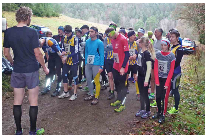
Běhu se letos zúčastnilo pětáctýřicet závodníků.

Letos Běh Boudeckou roklí uzavíral nultý ročník nového běžeckého