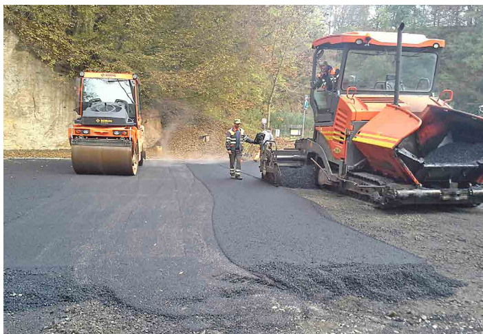
Nového povrchu se dočkalo i parkoviště.

My to vlastně přesně nevíme ani dnes. Proto si město na akci muselo vzít úvěr, což zastupitelstvo schválilo i bez toho, že by znalo výši do-