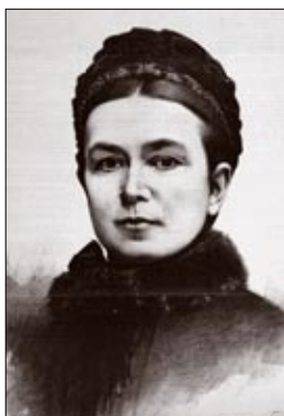
Portrét zamlada První česká lékařka Anna Bayerová (1852–1924) byla v čase svých švýcarských studií pilná, výkonná, ale i krásná dáma. Stopy prostého venkovského původu bychom v jejím ušlechtilém zjevu hledali marně.

jila jsem si speciální masáže v Baden Badenu, sloužila jsem v Drážďanech i Lipsku, dokonce jsem jeden čas v Anglii pečovala o choromyslnou bohatou šlechtičku. Leckde jsem ovšem pro mužské kolegy zůstávala tou podivinkou a černou ovci, co nějakým zábrakem dokázala vystudovat medicínu. Ale jestli se mne ptáte na dlouhodobou lékařskou kariéru, otevřeně říkám, že mi ji osud nedopřál.