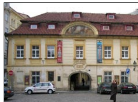
Dům U Halánků

Čítárna a klubovna tehdy nejautoritativnějšího ženského spolku v Praze, Amerického klubu dam. Místnosti svého domu U Halánků na Betlémském plácku propůjčil ženám činnorodý mecenáš Vojta Náprstek, který v roce 1865 založení klubu fakticky inspiroval. Po desetiletém pobytu ve Spojených státech začal přednáškami, výstavami a hlavně nápady rozvíjet maloměstský zrostatělou pražskou společnost. Náprstek, od mládí přesvědčený o rovnoprávnosti „krásného pohlaví“, vybudoval ve spolupráci s Karolínou Světlou a dalšími ženami živé kulturně vzdělávací centrum. Do Amerického klubu začala nadšeně docházet