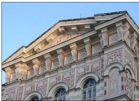
Detail průčelí z Vodičkovy ulice