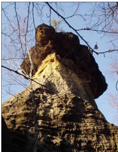
Rodiště první české lékařky obklopují lesy, rybníky, mokřady na říčce Pšovce a také tyto působivé pískovcové útvary podobné houbám s klobouky, tzv. Pokličky.

Na mnoha místech, ale jestli to mám říct natvrdo, tak dlouhodobě a se vši svou kvalifikací nikde. Působila jsem na řadě míst ve Švýcarsku, třeba jako terénní doktorka v Alpách, asistovala jsem v plicním, pak vodoléčebném sanatoriu, byla jsem lékařkou v dívčím ústavu, osvo-